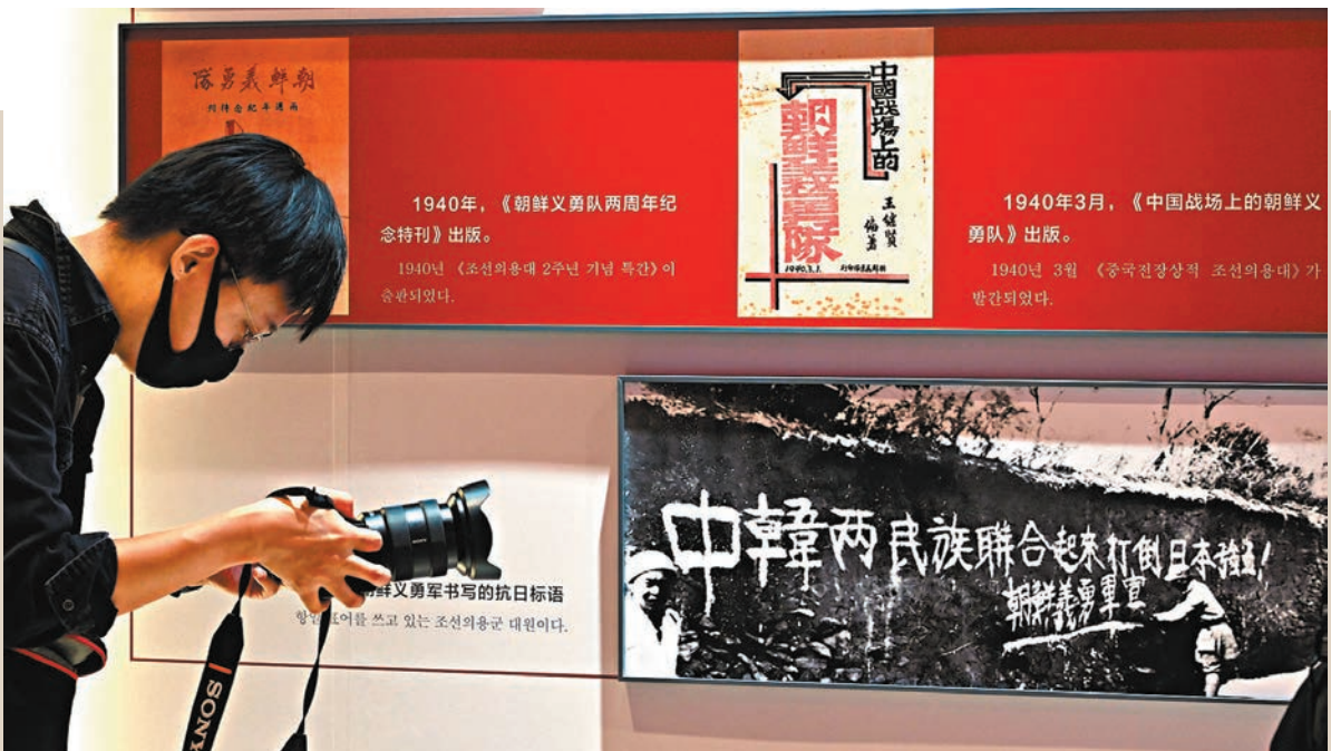
◆中國人民抗日戰爭紀念館舉辦「中韓共同抗戰」專題展覽，一名記者拍攝介紹當年在華朝鮮義勇軍書寫的抗日標語的圖片展板。