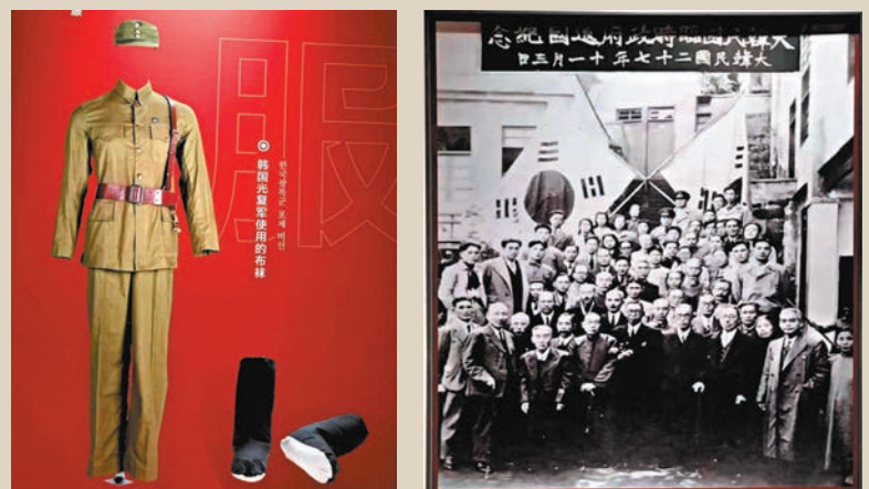
◆韓國光復軍軍裝。 香港文匯報記者馬曉芳攝 ◆1945年，大韓民國臨時政府歸國紀念合影。 香港文匯報記者馬曉芳攝