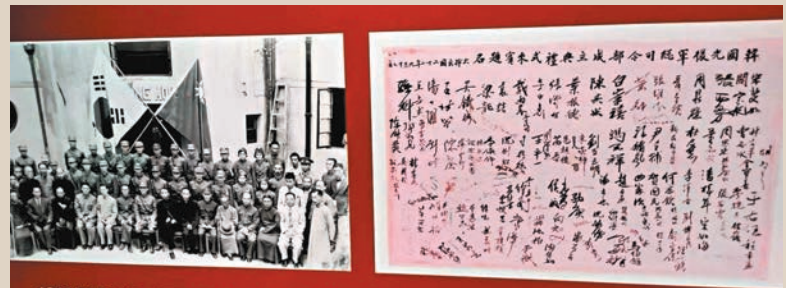
◆1940年韓國光復軍總司令部成立典禮在重慶舉行，周恩來、董必武等到場祝賀並簽名。