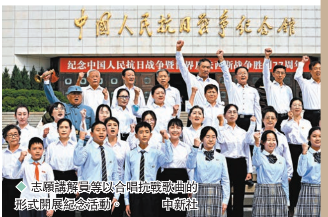
志願講解員等以合唱抗戰歌曲的形式開展紀念活動。