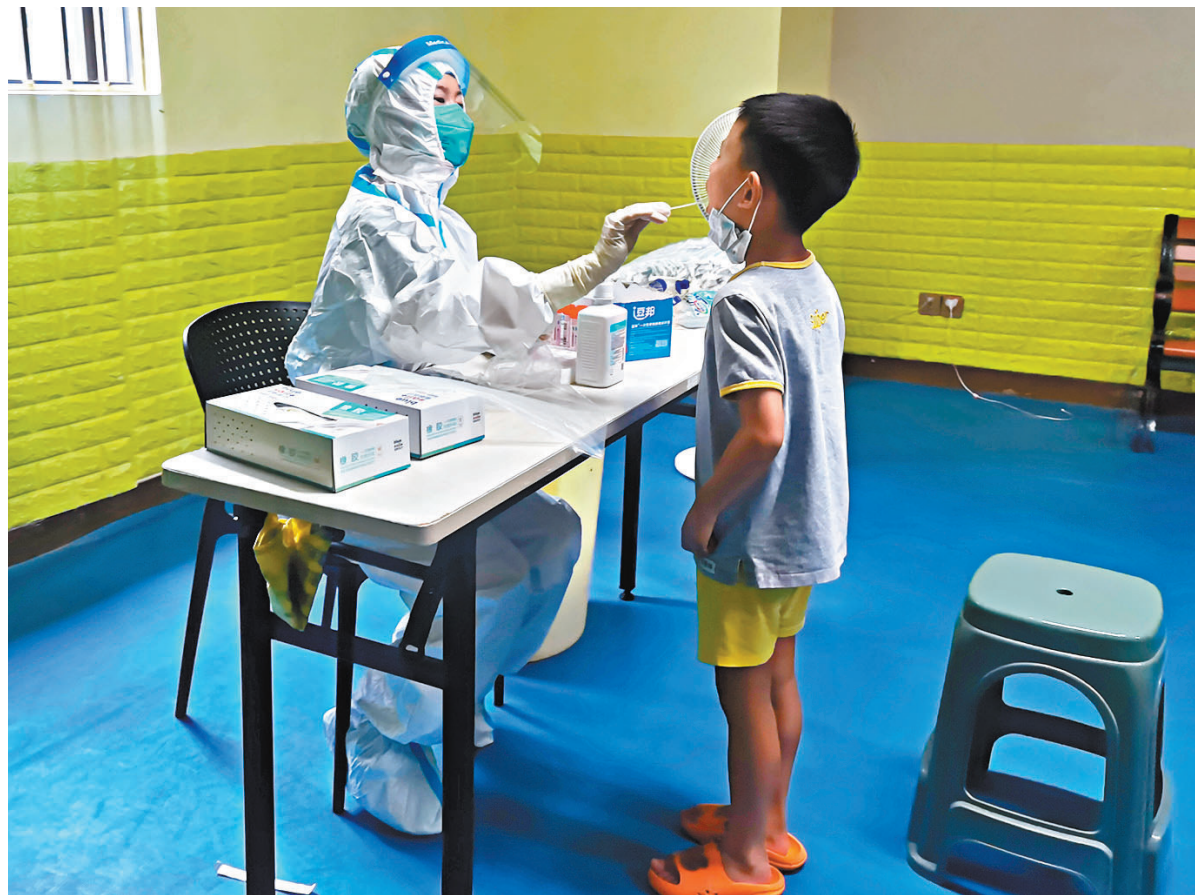
◆9月3日0-12時，深圳新增33例陽性病例，其中3例在社區篩查中發現。圖為深圳市民在核檢採樣。

在生活保障方面，企業加大運轉力度，市民通過網絡平台下單買菜訂餐，配送到小區卡口或快遞點，內外包裝消毒，外包裝不入戶，實現無接觸式配送，市民感覺很便利。部分雙休日兩輪核檢的區，公交、地鐵停運。但因就醫、考試的人員，憑社