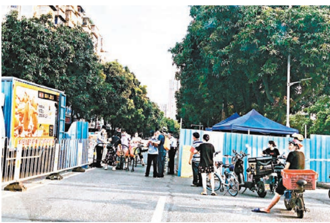
◆9月3日，廣州天河、荔灣、增城等區先後發布全員核檢檢測工作，且居民須連續2天接受檢測。圖為早前廣州荔灣區東漱街實行封閉管理。 資料圖片

海珠區、番禺區處於廣州城區珠江兩岸，疫情以及相關防控措施導致珠江南北兩岸人員、車輛往來減少，海珠橋上的車流密度明顯不如往常。 持續出現感染者，社區傳播風險提高，廣州各區均相應提高了核檢檢測力度。9月3日，廣州天河、荔灣、增城等區先後發布全員核檢檢測工作，且居民須連續2天接受檢測。在荔灣區，以區疫情防控辦公室的名義，向轄區內的居民發送短信，提醒居民完成當天的核檢採樣。疫情