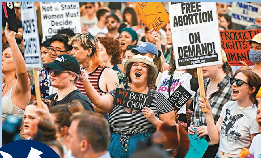
美國的政策正在分裂，特別在有關墮胎權等重要議題上。資料圖片