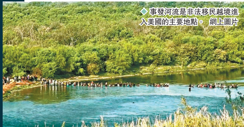
事發河流是非法移民越境進入美國的主要地點。