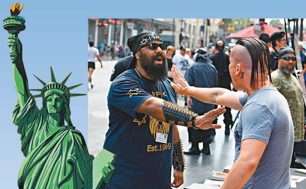
美國社會撕裂加劇，兩派人士屢發生衝突。