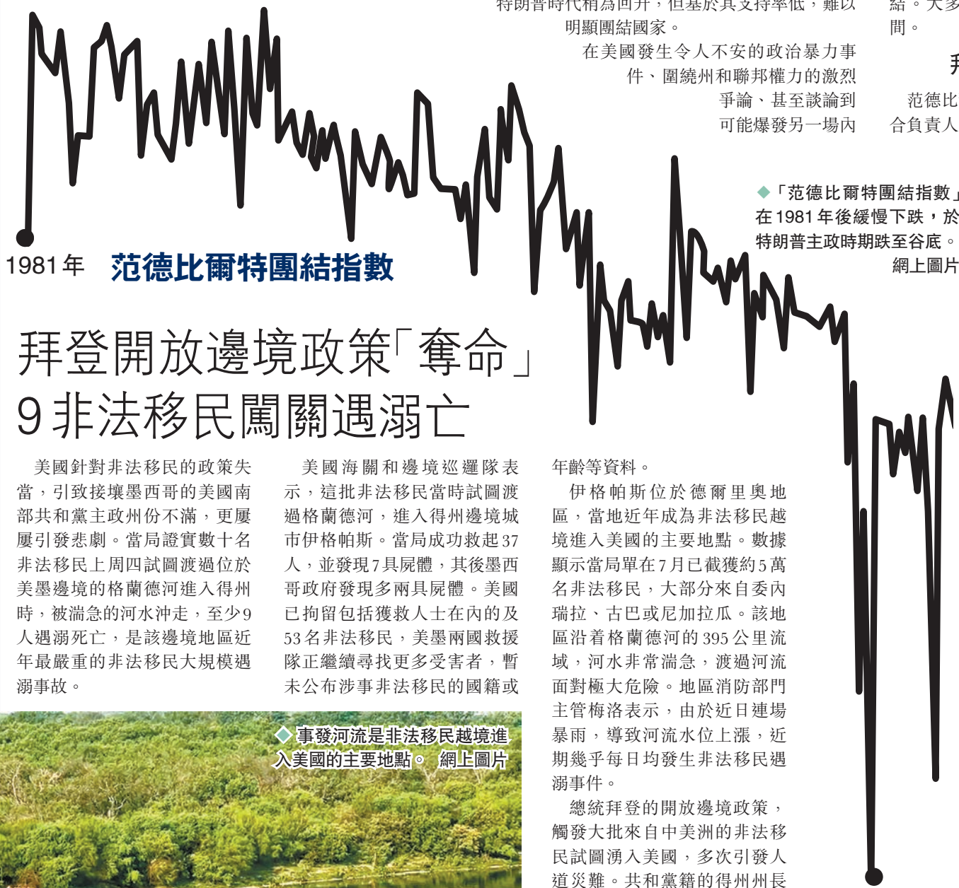
「范德比爾特團結指數」在1981年後緩慢下跌，於特朗普主政時期跌至谷底。