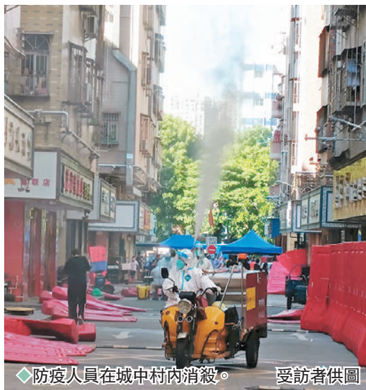
◆防疫人員在城中村內消毒。