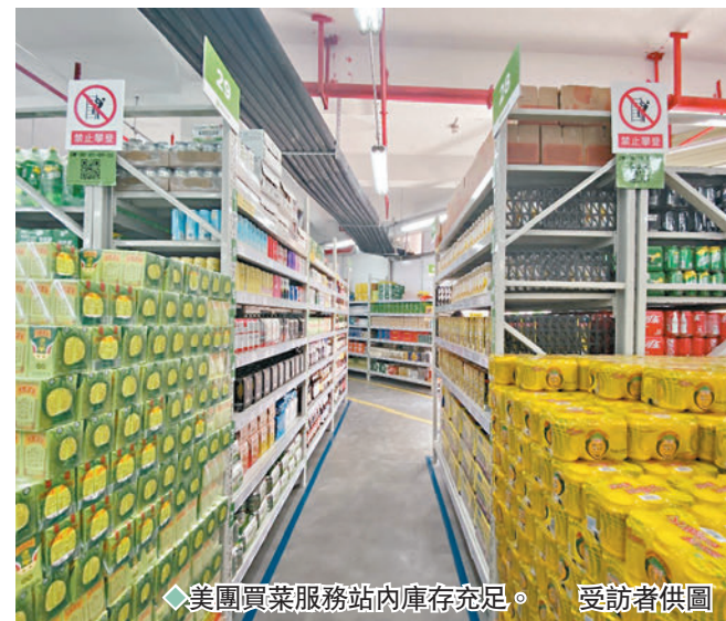
◆美團買菜服務站內庫存充足。