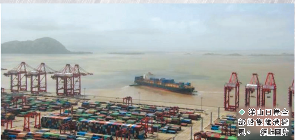
◆洋山口岸全部船隻離港避風。

中央氣象台4日6時繼續發布颱風黃色預警,預計「軒嵐諾」將以每小時15-20公里的速度向北偏西方向移動,強度將逐漸加強,並逐漸向浙江東北部近海靠近,4日夜間到5日早晨將在浙江近海海面上,5日上午開始轉向東北方向移動,趨向朝鮮半島南部到朝鮮海峽一帶。