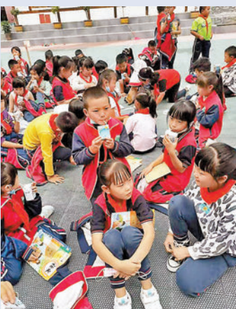
◆冷碛鎮小學生在操場上避險。