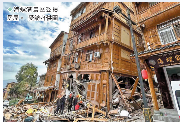
◆海螺溝景區受損房屋。

中國大熊貓保護研究中心表示，地震發生後，各基地緊急開展了排查工作，目前人員及大熊貓都平安。 ◆香港文匯報記者 向芸 四川報道