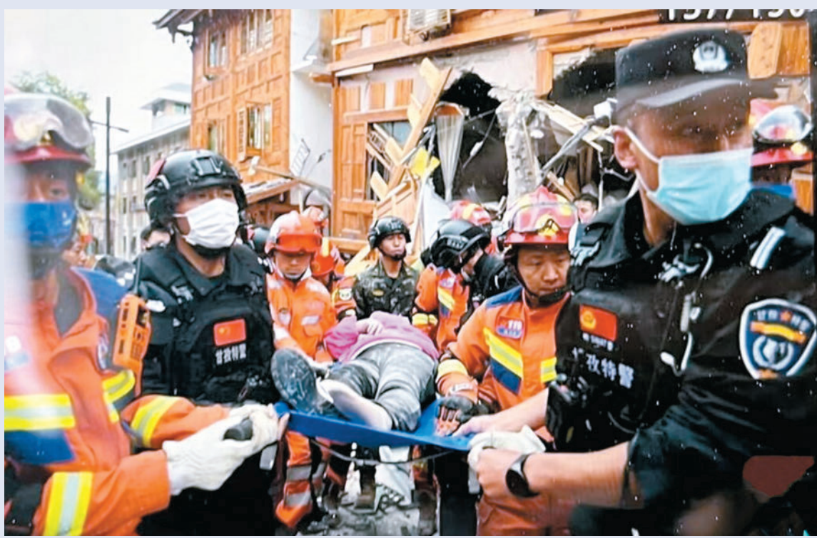
◆國務院抗震救災指揮部辦公室、應急管理部立即啟動國家地震應急三級響應，國家減災委、應急管理部啟動國家IV級救災應急響應。圖為震中磨西鎮受困人員獲救。

為支持四川省做好地震救災工作，5日財政部緊急預撥四川自然災害救災補助資金5,000萬元，統籌用於應急搶險和受災群眾救助，重點做好搜救轉移安置受災人員、排危除險等應急處置，以及次生災害隱患排查和應急整治、倒損民房修復等。