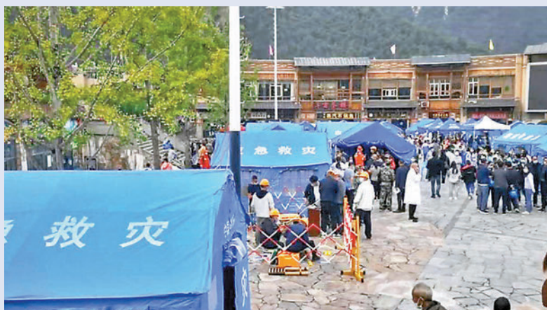
◆磨西鎮部分房屋受損，進出磨西鎮的幾條道路已全部中斷，旁邊山體不時有土石滑落。圖為磨西鎮廣場建立的防震棚。