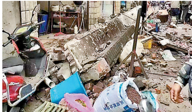
◆四川省甘孜州瀘定縣磨西鎮附近發生6.8級地震，震源深度16千米，成都、重慶、雲南、貴州均有震感。圖為地震中受損的房屋。