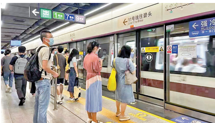
◆深圳分級分類管控首日，地鐵正常運行，市民有序乘車出行。

香港文匯報記者從深圳地鐵集團獲悉，周一通勤客流高峰，為保障乘客通行，深圳地鐵各線均安排最大運力的運行圖，全網共安排416列上線運行。針對地鐵車站和列車等公共場所，深圳地鐵嚴格執行列車消毒、加強車站保潔及消毒、加強車站及軌道區域通風換氣、重點車站開展管控客流等多項措施。根據客流與車站特點，安排重點車站每2-3小時進行一次消毒，並對乘客較多接觸的安檢機、閘機、扶梯等設備進行重點消毒。每列上線列車都會嚴格消毒，也增加了清潔更換空調濾網的頻次。