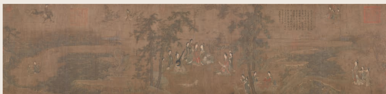
阮郛 閻苑女仙圖 ◆此畫被認為是五代阮郛唯一的傳世真跡，以巨幅卷軸表現豐富畫面，並以女性為主題，十分罕見。

◆依次圖繪《詩經》中《鹿鳴》等十篇詩意，此卷曾經明黔寧王府、錢能、清內府等遞藏，在清宮所藏《詩經圖》中，此卷水準最高。