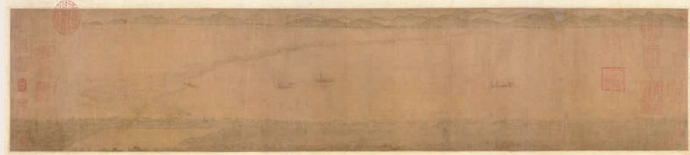
李嵩 錢塘觀潮圖 ◆是現存最早表現錢塘江漲潮盛況的畫卷之一，以即景寫實的手法、俯瞰式構圖，刻畫漲潮時波濤漸起及船隻緊急歸岸的情景。