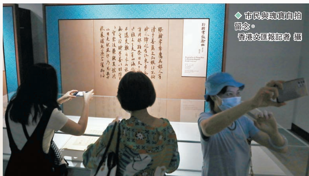
◆市民與瑰寶自拍留念。