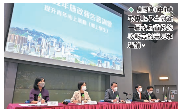
◆陳國基(中)聽取專上學生對新一屆政府首份施政報告的意見和建議。