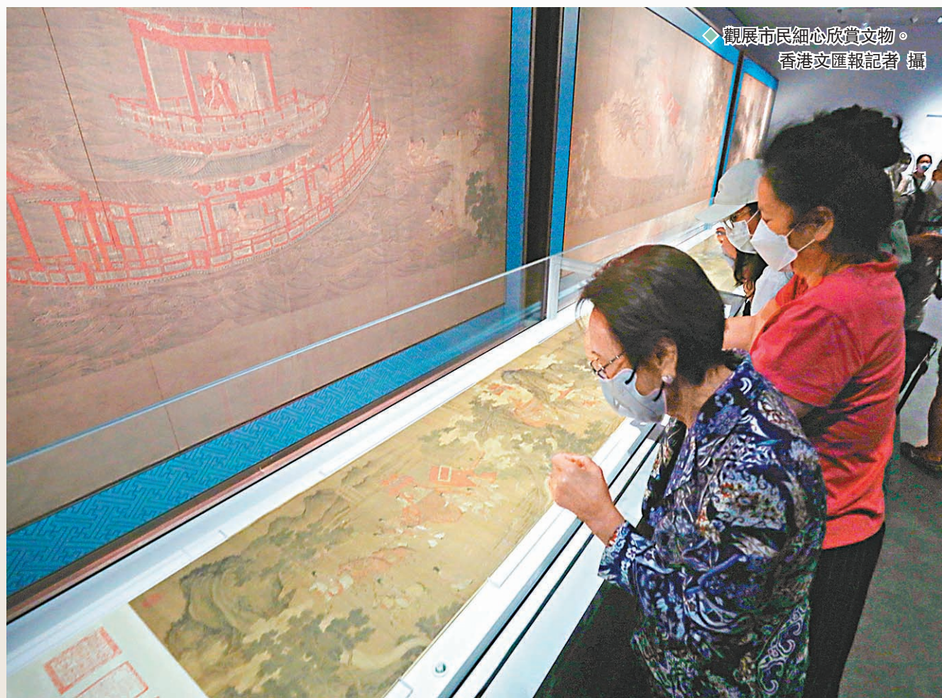
◆觀展市民細心欣賞文物。