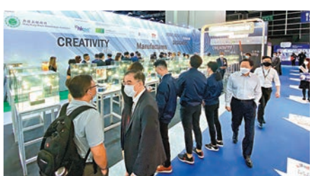
貿發局「香港鐘錶展」吸引大批市民前往參觀。

今年除了展出各大品牌的作品之外，亦設有一系列論壇和研討會，今年的主題為「未來鐘表——轉化與創新」，請來市場調查機構及拍賣專家分析市場的最新發展及趨勢、業界如何應用區塊鏈技術進行交易，以及投資NFT的前景等嶄新題材。