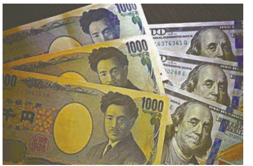
◆美元走強下，日圓持續貶值。 資料圖片

美元兌日圓走勢，技術圖表同樣可見RSI及隨機指數仍告上行，此外，自7月下旬以來美元兌日圓形成一組雙底形態，頸線位置為8月8日高位135.57，隨着上週升破此區以及25天平均線，可望美元兌日圓仍有上行動力，當前目標會指向周三未有突破的145水平，其後關鍵在1998年8月高位147.63，當年正是日本央行上一次干預的時點，在1998年4月至6月動用總計超過3萬億日圓去支撐匯率，故此區亦顯得更為重要，之後關鍵亦只有指向150這個心理關口。至於較近支持料為143.30及142，關鍵回看140關口。