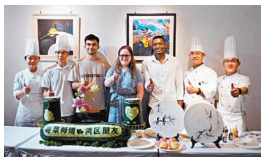
◆9月9日下午，廣州市大灣區文化交流促進中心主辦「粵菜師傅和TA的灣區朋友們中秋沙龍」活動，多位外籍友人共聚一堂，共話中秋文化，共享中國美食。