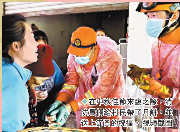
◆在中秋佳節來臨之際，消防員們給村民帶了月餅，並送上節日的祝福。視頻截圖

▶9月8日一早，各村村民、愛心人士、老年協會阿嬢等在各點位做起了花饅饅，大家分工合作，把道孚人民的祝福做成一個一個寓意美好的「同心圓」。