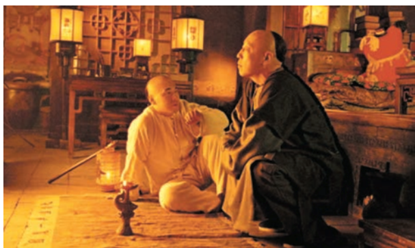
◆電視劇《喬家大院》劇照。

人或狗進入之後，就會異常驚恐，四處逃竄。而糧倉裏的老鼠，生活狀態卻是安逸優越的，居住在舒適的環境中，吃着囤積的大米，沒有人和狗的憂慮。廁鼠和倉鼠不同的生活境遇使李斯非常地感嘆：「人之賢不肖譬如鼠矣，在所自處耳！」一個人發展和境遇的好壞，就如同老鼠一樣，是由自己所處的平台和環境決定的。「寧為倉鼠，不為廁鼠」，為人生追求更高更大的平台，深深地影響了李斯的人生選擇。他沒有滿足現狀，師從於荀子，並棄楚入秦謀求發展，又借呂不韋、趙高的平台贏得秦王的賞識，以卓越的政治才能和遠見，輔助秦王完成了統一六國的大業，之後又推動廢除分封制，實行郡縣制，統一文字、法律、貨幣、度量衡和車軌等重大改革，也從廷尉躍居丞相，實現了自己人生理想的最大化。