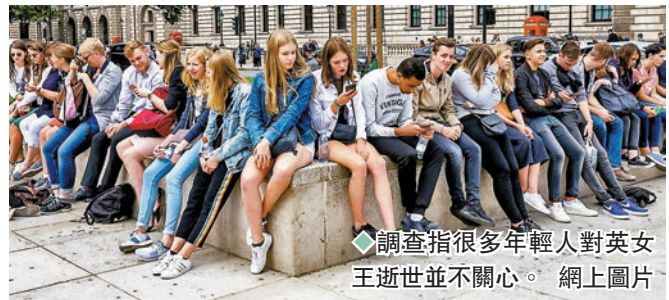
調查指很多年輕人對英女王逝世並不關心。