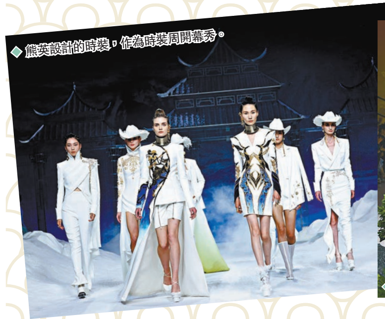
熊英設計的時裝，作為時裝周開幕秀。