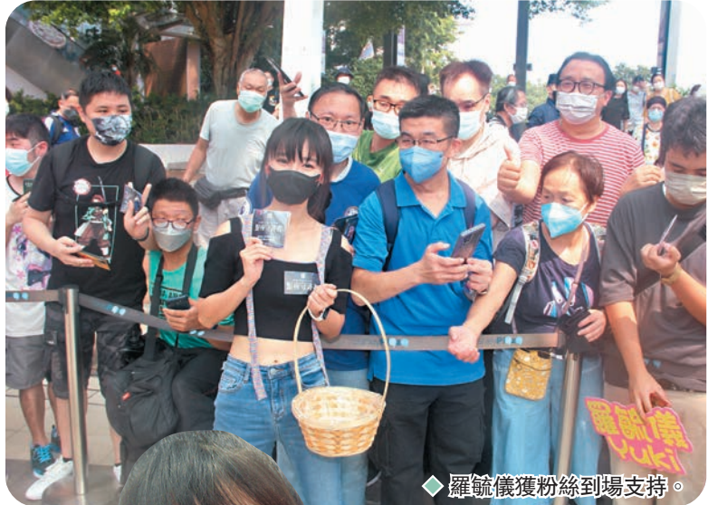
羅毓儀獲粉絲到場支持。