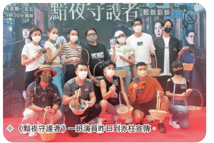
◆《黯夜守護者》一班演員昨日到赤柱宣傳。