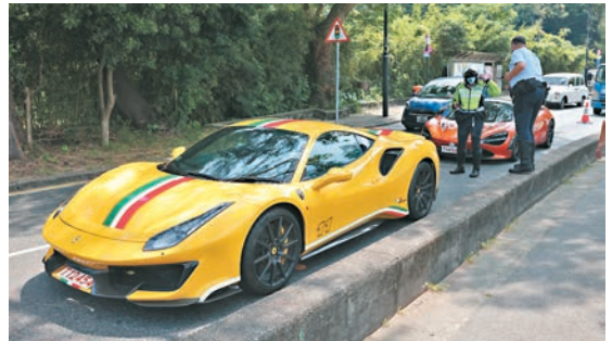
◆警方昨晨於港島南區展開反非法賽車行動。

香港文匯報訊（記者 蕭景源）中秋節長假期，警方預計會有司機於港島區傳統熱點非法賽車，遂於昨晨在港島南區展開反非法賽車及反超跑行動，其間成功截停包括法拉利、林寶堅尼在內的7輛超跑跑車，7名男司機和1名女乘客分涉非法賽車、危險駕駛及未獲授權而取用運輸工具等罪名被捕。調查發現，他們在限速50公里的路面上以近100公里時速飛馳，當中5名司機更涉年初另一宗危險駕駛案被捕。