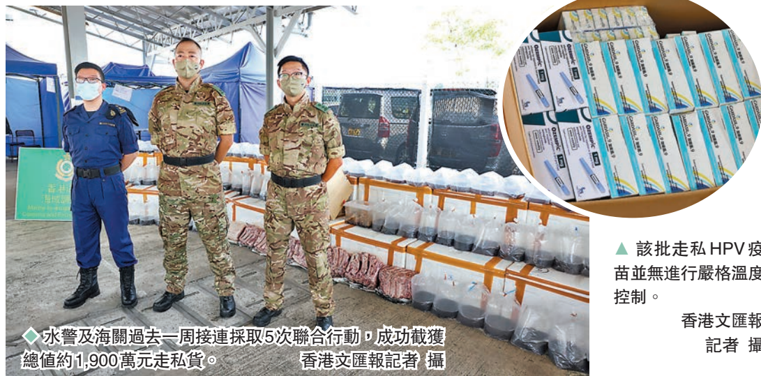
◆水警及海關過去一周接連採取5次聯合行動，成功截獲總值約1,900萬元走私貨。

劉家業指出，從不法分子逃走路線來看，相信走私貨品計劃偷運往內地。由於走私團夥每每在深夜時分，揀選偏遠水域進行走私，同時不開航行燈，故對其他海上船隻構成危險。雖然水警追截過程十分驚險，但警方有信心及有能力打擊此類走私活動。