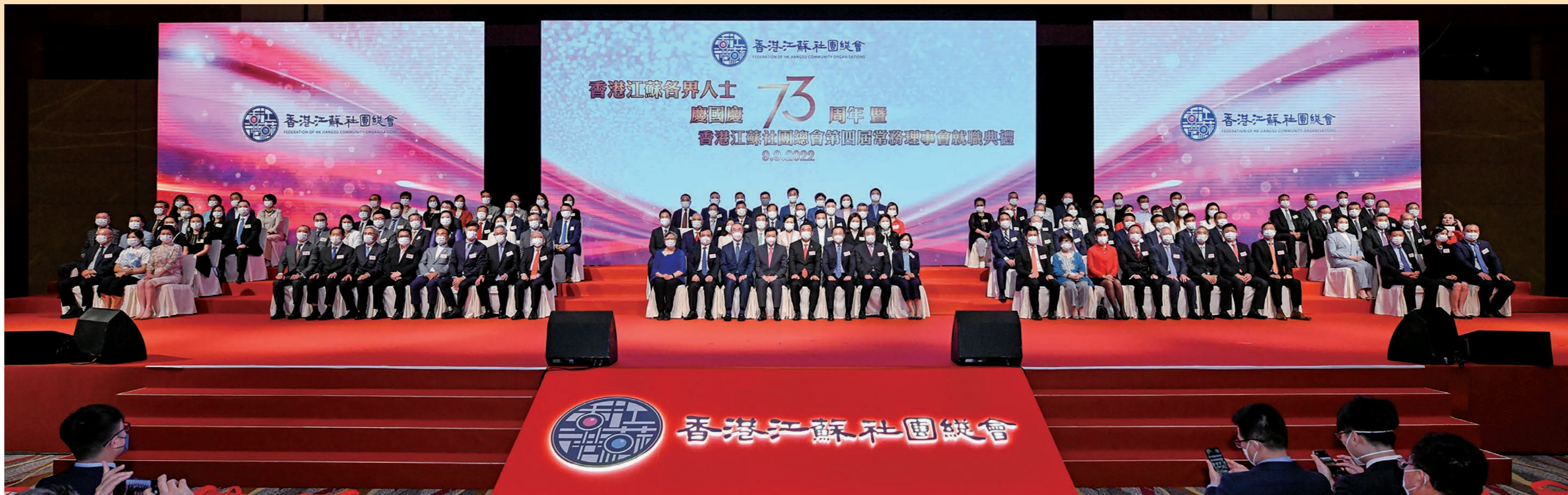
◆香港江蘇各界人士慶國慶73周年暨香港江蘇社團總會第四屆常務理事會就職典禮假香港會議展覽中心舉行，賓主大合照。

香港特區行政長官李家超應邀出席典禮，擔任主禮嘉賓並致辭。香港中聯辦副主任何靖、外交部駐港副特派員方建明、立法會主席梁君彥、特區政府民政及青年事務局局長麥美娟、原全國人大常委范龍泰、香港中聯辦社聯部副部長黎寶忠、香港義工聯盟主席譚錦球等出席主禮。