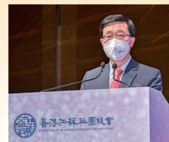
◆李家超行政長官致辭

9月9日，香港江蘇各界人士慶國慶73周年暨香港江蘇社團總會第四屆常務理事會就職典禮假香港會議展覽中心圓滿舉行。蘇港兩地的社會賢達、香港社會各界的賓朋良友濟濟一堂，通過線上線下形式，在喜迎國慶之際，逾千人共同見證第四屆會長姚茂龍與第四屆常務理事會就職。