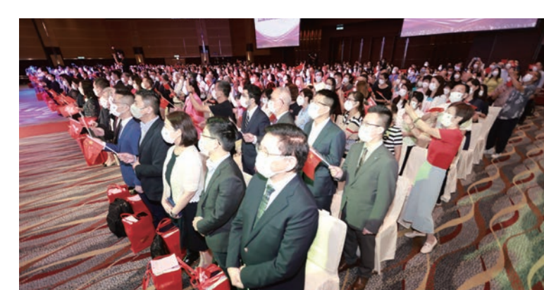
◆香港江蘇各界人士慶國慶73周年暨香港江蘇社團總會第四屆常務理事會就職典禮，全場大合唱《歌唱祖國》。