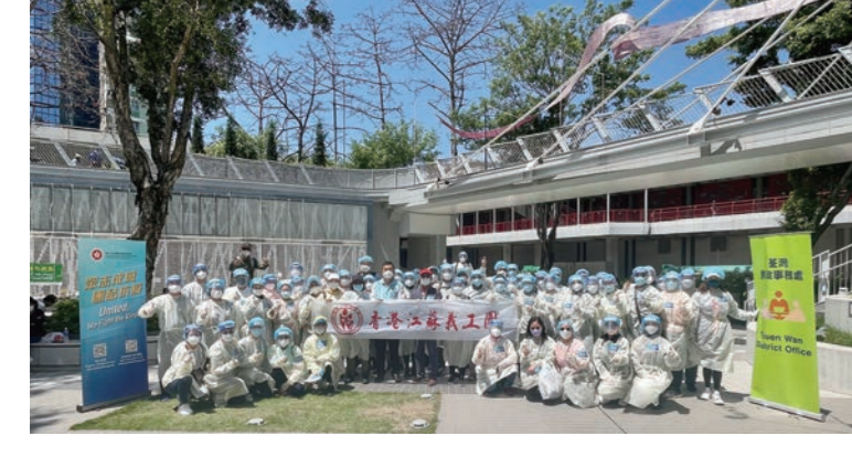
◆香港江蘇義工團支持抗疫。