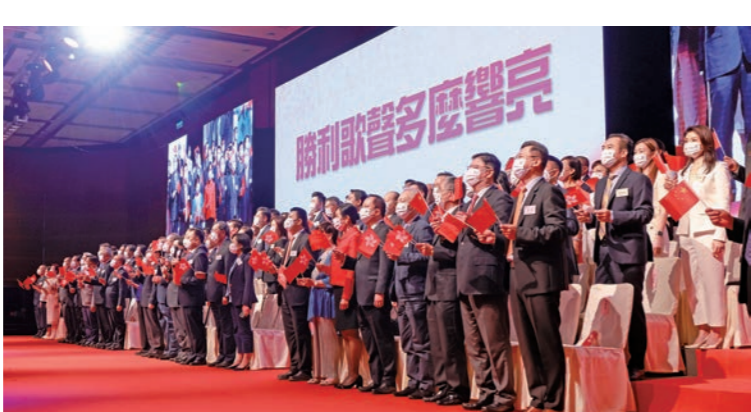
◆總會舉辦香港故宮文化博物館專場參觀活動。