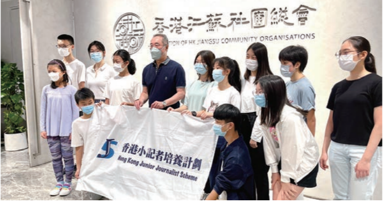
◆總會成功主辦「香港小記者培養計劃」第一期訓練班。