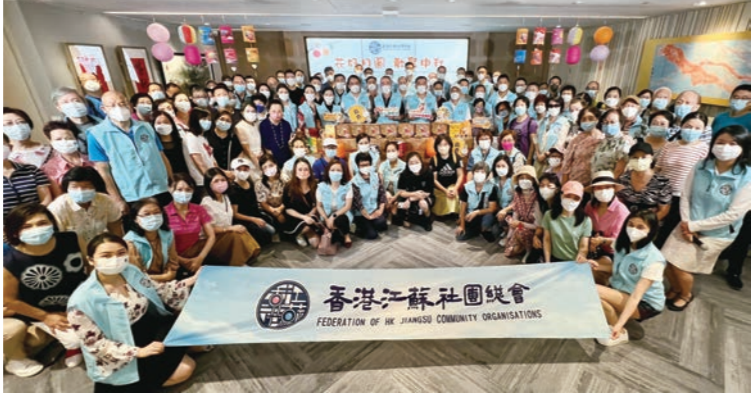
◆「花好月圓歡聚中秋」——總會舉辦中秋愛心活動。