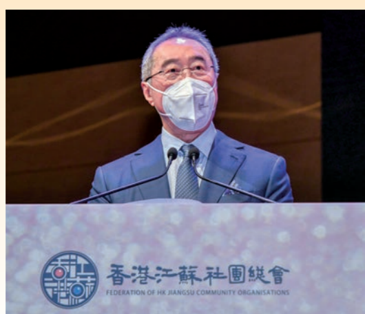
◆唐英年創會會長致辭