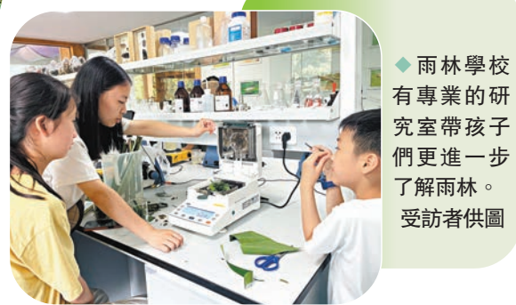
雨林學校有專業的研究室帶孩子們進一步了解雨林。

西雙版納望天樹景區，穿過各種珍貴植物花卉包圍的林蔭大道，雨林學校幾個彩色大字映入眼中，順着樓梯來到學校門口，透明玻璃窗裏，顯微鏡和實驗用的器皿應有盡有，旁邊還存放着一些種子標本和鳥巢標本。