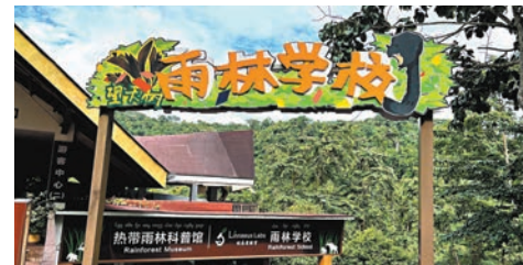
西雙版納雨林學校就在熱帶雨林裏。