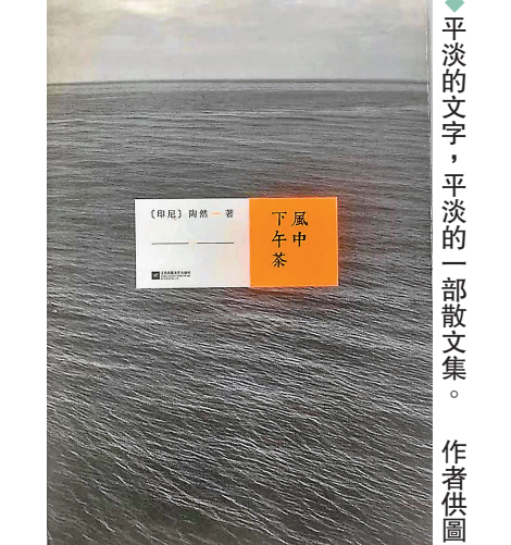
◆平淡的文字，平淡的一部散文集。

月是故鄉圓，兒時在印尼過節，陶然最溫馨。但一家團聚的日子，終也散了。最後「遷移」到香江，努力耕耘，成了作家。