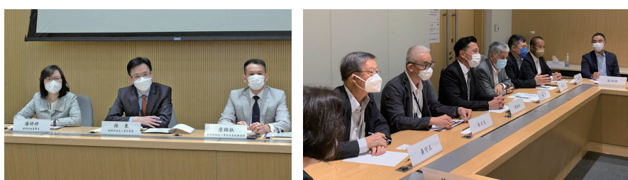
創新科技及工業局局長孫東希望與「產學研」加強合作。