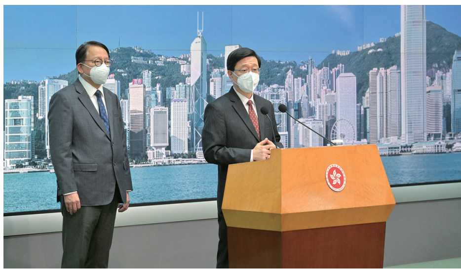
行政長官李家超9月1日會見傳媒，透露粵深支持「逆向隔離」建議，並同意設立專班推進落實。

久未通關令業界在內地營商遇上一定困難，實施此兩項政策為業界帶來便利，是兩地恢復正常人員往來的好開始。紡織及製衣界十分歡迎及支持，期望兩地能夠盡快展開對接工作，為工商界帶來好消息。