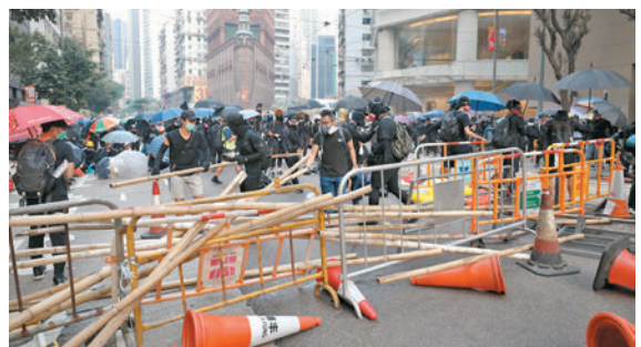
◆2019年9月29日黑暴分子趁港島非法遊行掀起暴亂。

香港文匯報訊（記者 葛婷）黑暴分子於2019年9月29日趁港島非法遊行圍攻政府總部掀暴亂，共有96人被控暴動等罪。涉案其中一批9名被告的案情昨在區域法院開審，其中6人在開審前認罪，押後至11月14日求情。據被告承認的案情顯示，有4名被告被拍攝到穿黑衣以「豬嘴」（防毒面罩）等蒙面，在夏愨道