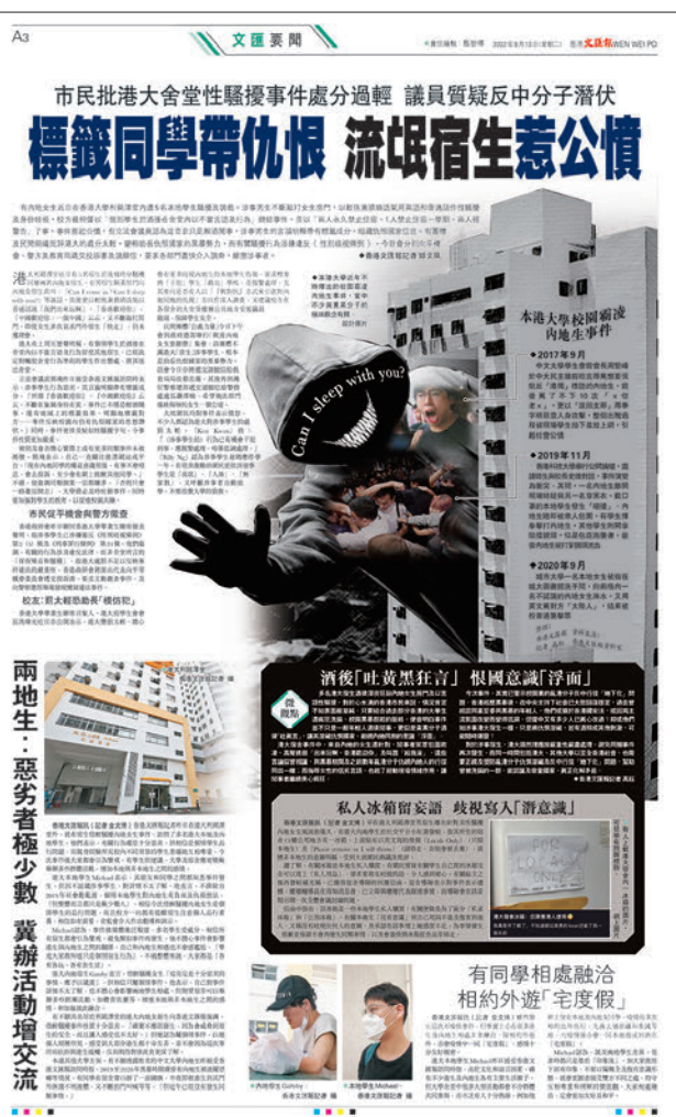
◆港大內地女宿生遭欺凌，香港文匯報昨日跟進報道引起重視。

包容和煽動性言論及行為只會令社會分化加劇，破壞社會團結，必須予以制止及譴責。 他指平機會已於去年向政府提交立法建議，以處理本港出生居民和內地來港人士的歧視及騷擾問題，獲政府積極跟進。平機會會研究今次事件中涉及的欺凌和騷擾行為，是否已違反現行相關條例。