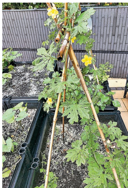
◆苦瓜靠著自己和大自然的力量，本來活得好好的。

暑假離開香港前往外地旅行前，我參加了宿舍一個有機種植的計劃。我在花盆泥土上撒了幾粒苦瓜種子，然後便離開了香港。外地旅行時，我沒有特別想起那幾粒苦瓜種子，甚至預設了它們不會發芽成長，因為將近兩個月沒有人為它們淋水，在炎熱的夏天裏，我覺得它們難以生存。