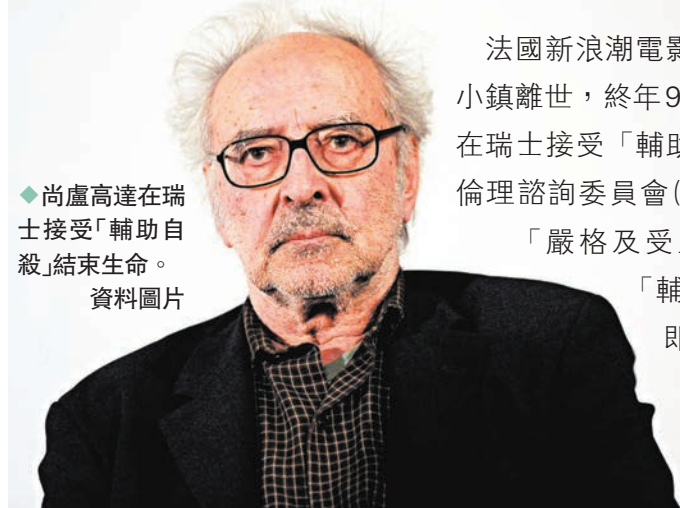
◆尚盧高達在瑞士接受「輔助自殺」結束生命。 資料圖片

法國新浪潮電影大師尚盧高達前日在瑞士一個小鎮離世，終年91歲，其律師證實，尚盧高達是在瑞士接受「輔助自殺」結束生命。而法國國家倫理諮詢委員會(CCNE)同日發表報告，建議在「嚴格及受監管」的條件下，可合法進行「輔助自殺」，法國總統馬克龍隨即宣布啟動關於終結生命的全民辯論，為最終實施安樂死合法化踏出重要一步，扭轉當局一直禁止安樂死的立場。