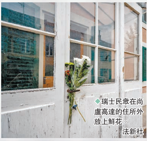
◆瑞士民眾在尚盧高達的住所外放上鮮花。

法國新浪潮電影大師尚盧高達前日在瑞士一個小鎮離世，終年91歲，其律師證實，尚盧高達是在瑞士接受「輔助自殺」結束生命。而法國國家倫理諮詢委員會(CCNE)同日發表報告，建議在「嚴格及受監管」的條件下，可合法進行「輔助自殺」，法國總統馬克龍隨即宣布啟動關於終結生命的全民辯論，為最終實施安樂死合法化踏出重要一步，扭轉當局一直禁止安樂死的立場。