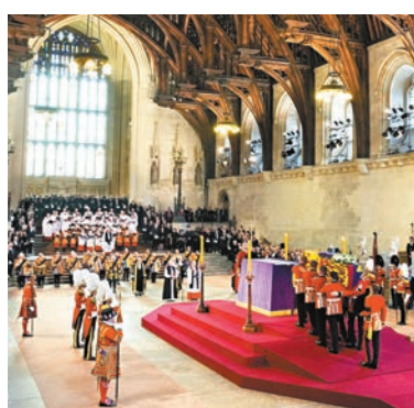
◆靈柩停放在西敏宮後，由坎特伯雷大主教主持祈禱儀式。