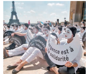
◆法國有民調顯示多達93%民眾支持安樂死。圖為反對安樂死的人士發起抗議。