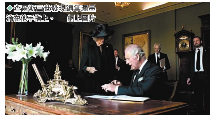
◆查爾斯三世發現鋼筆漏墨滴在他手指上。