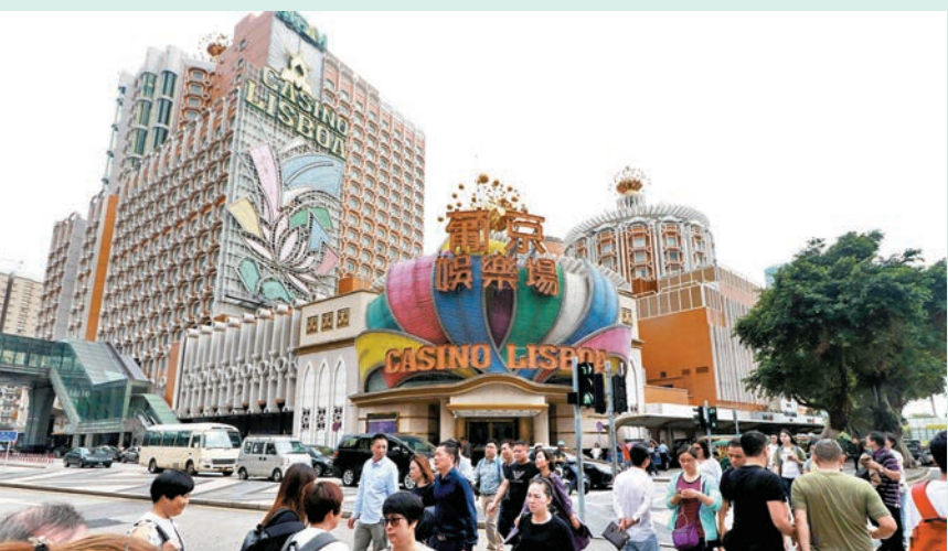
◆ 澳門新一輪賭牌競投昨日開標後宣布，7家公司獲接納參與競投，競逐6張賭牌。