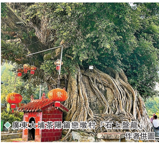
廣東大埔茶陽鎮慈墩村「石上盤龍」。

我曾經非常困惑，一個深受儒家傳統文化影響的家族，為什麼會有35人從事政治活動？原來，在「五四」新文化運動前後，他們的前輩饒百我在香港擔任家庭教師期間，經常將《新青年》等書籍，帶回義訓堂供子侄們閱讀，播下了革命的星星之火。其情形，正如福州書香門第、林氏家族的林覺民，毅然決然寫下絕筆《與妻書》，追隨黃興等革