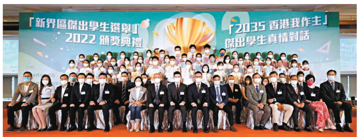
◆「新界區傑出學生選舉」2022頒獎典禮暨「2035香港我作主」傑出學生真情對話活動於昨日舉行。

花毯展覽回歸25載 為慶祝香港回歸祖國25周年,「東區賀回歸花毯展覽」由昨日(18日)至本月25日在筲箕灣東區文化廣場舉行,展出包括以超過3萬株花卉植物,拼砌出一幅直徑達18米的圓形花毯,當中包括多個東區著名的建築物圖案,展示在祖國帶領下,充滿生機的東區和欣欣向榮的香港。展覽入口亦展出由約3,000枝「毋忘我」砌成、接近1.7米高的大型「25A」立體造型花藝裝飾,體現祖國與香港的濃厚情誼。