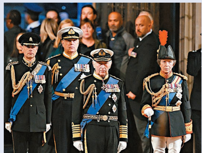
◆穿上軍服的查爾斯三世(前)與愛德華王子(左一)、安德魯王子(左二)及安妮公主(右)前晚在女王靈柩旁進行守夜儀式。