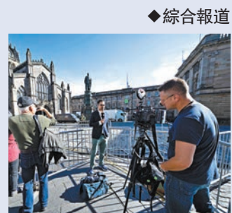
◆有傳媒人士指已就今次工作「綵排」了30年。

奧運開幕禮演出，吸引35億觀眾收看的紀錄，亦超過廣播界以往直播盛事的收看人數，包括2005年的Live8音樂會、2010年澳洲悉尼新年煙花匯演，以及查爾斯和戴安娜的世紀婚禮。