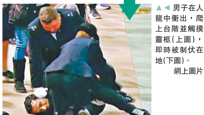
▲男子在人龍中衝出，爬上台階並觸摸靈柩(上圖)，即時被制伏在地(下圖)。