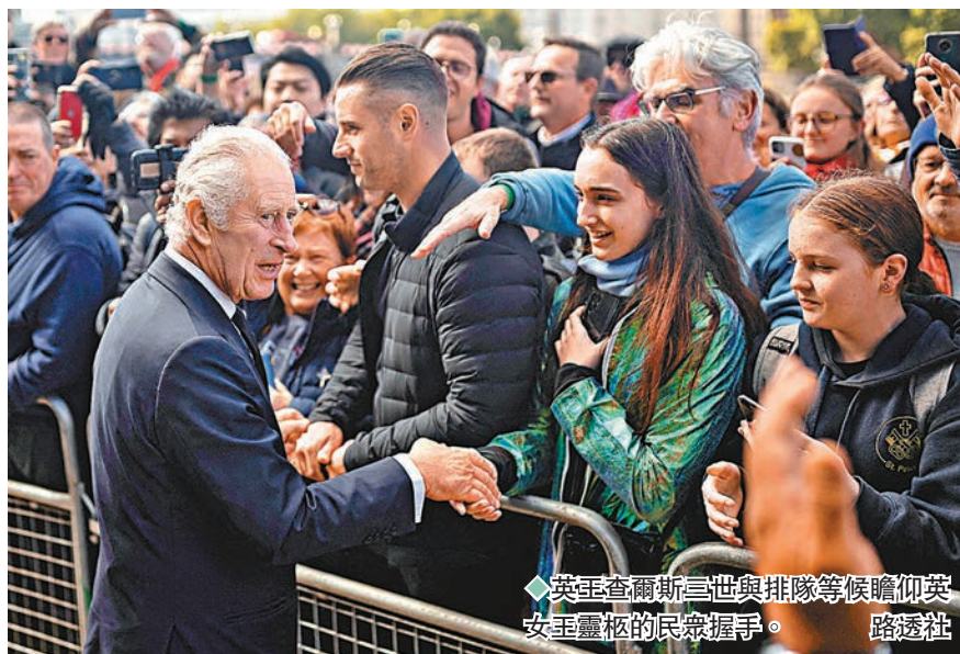
英王查爾斯三世與排隊等候瞻仰英女王靈柩的民眾握手。