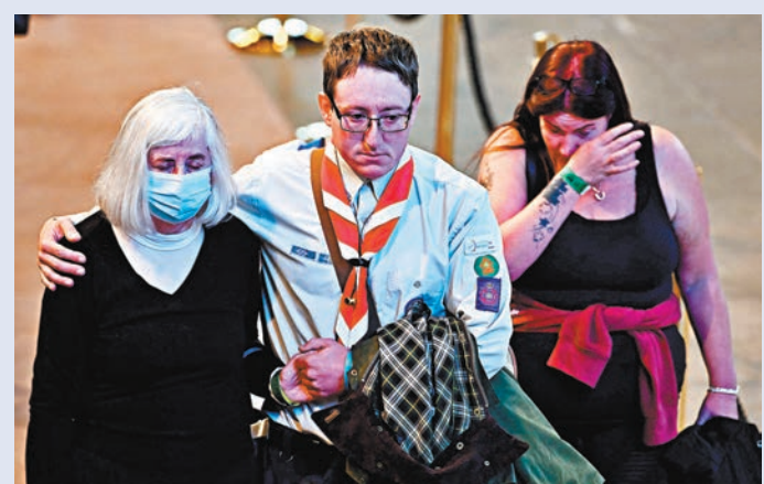
◆民眾瞻仰英女王靈柩後悲從中來，需由旁人安慰。