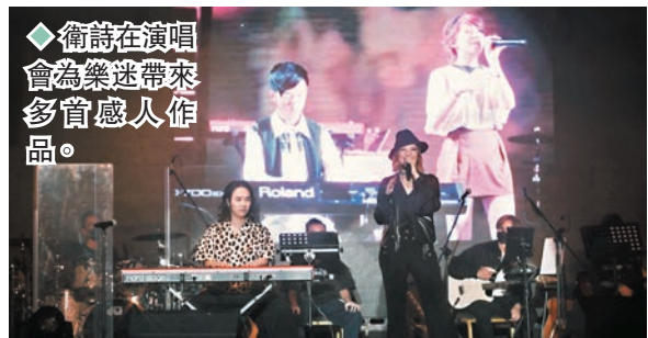
衛詩在演唱會上為樂迷帶來多首感人作品。

其後Jill再為觀眾帶來多首感人作品，最後安哥再出場跟全場大合唱《感情需要》為演唱會畫上句號。