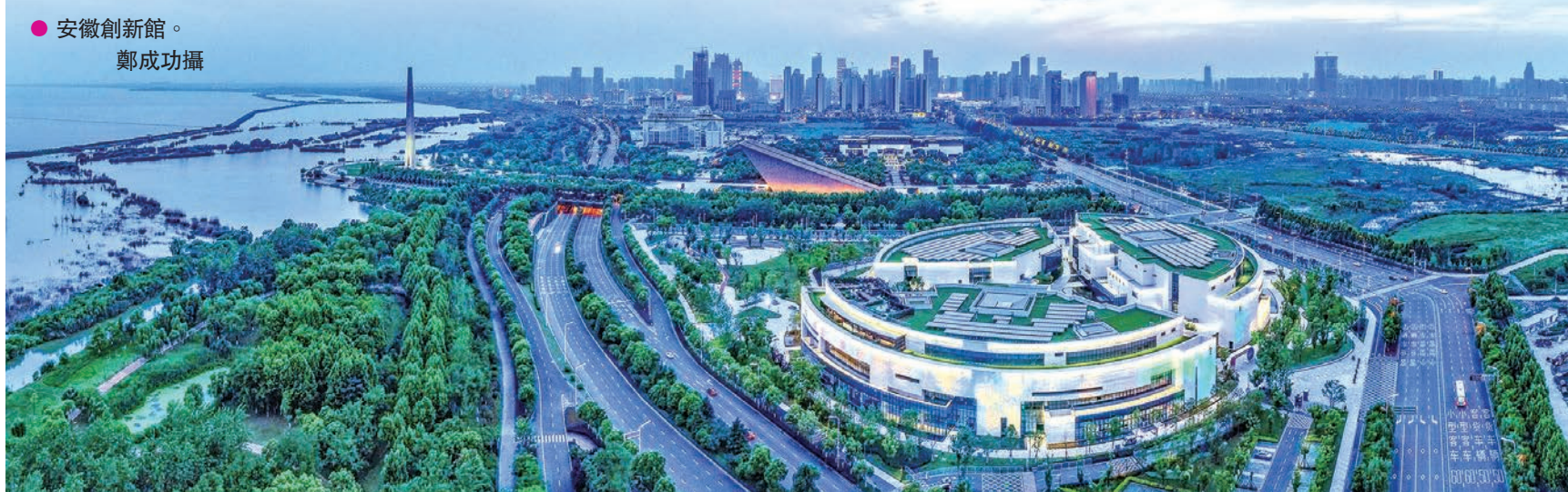
● 安徽創新館。鄭成功攝

的跨越發展。安徽製造業、數字經濟增加值都超1萬億元，全球10%的筆記本電腦、20%的液晶顯示屏在安徽生產，全國每3台冰箱、4台洗衣機、5台空調有1台是安徽製造。 實現了「內陸腹地」向「改革開放新高地」的跨越發展。安徽省級政府透明度全國第3，省級行政權力事項全國最少，市場主體日均新增3,000多戶，經貿朋友圈覆蓋全球97%的國家和地區。