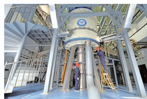
● 穩態強磁場實驗裝置。