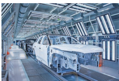
● 蔚來汽車新能汽車全鋁智

大會堅持走出去、引進來，以「科創+產業」「龍頭+配套」「基地+基金」模式，深化央企、民企、外企、港澳企、台企、僑企等「六百」項目對接活動，探索運用預對接、預撮合等精準方式，推動先進製造業領域「雙招雙引」擴量增效，目前大會擬集中簽約項目568項，總投資3,677億元（人民幣，下同），其中100億元以上項目8個，50億元以上項目15個，將有力支撐安徽打造具有重要影響力的新興產業聚集地。 今年大會將持續舉辦安徽省與央企合作發展座談會，屆時安徽省與有關央企簽訂戰略合作協議及重點合作項目；還將創新舉辦工業和信息化部屬高校與安徽省產教融合交流活動、中國工程院院土安徽行活動，將持續推動安徽省與部屬高校、中國工程院的合作交流，加強人才鏈、產業鏈、創新鏈有機銜接，助力安徽製造業提質擴量增效，打造國際戰略性新興產業集群，進一步推動現代化美好安徽建設。