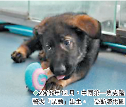
◆2018年12月,中國第一隻克隆警犬「昆動」出生。