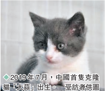
◆2019年7月,中國首隻克隆貓「大蒜」出生。