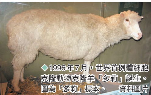
◆1996年7月,世界首例體細胞克隆動物克隆羊「多莉」誕生。圖為「多莉」標本。