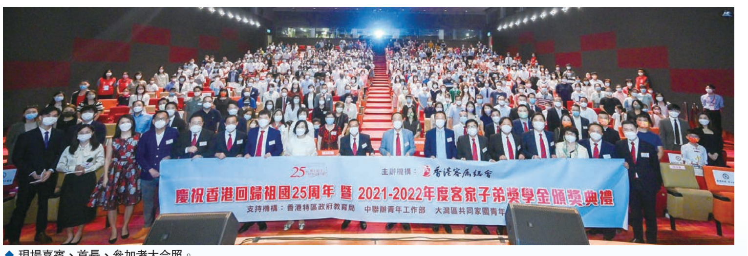
◆現場嘉賓、首長、參加者大合照。

是次客家子弟獎學金計劃共收到來自本港315所中小學、426個客家子弟學生申請,最終有101位小學生及103位中學生通過評選,分別獲得3,000港元及5,000港元獎學金,獎學金額總計近82萬港元。