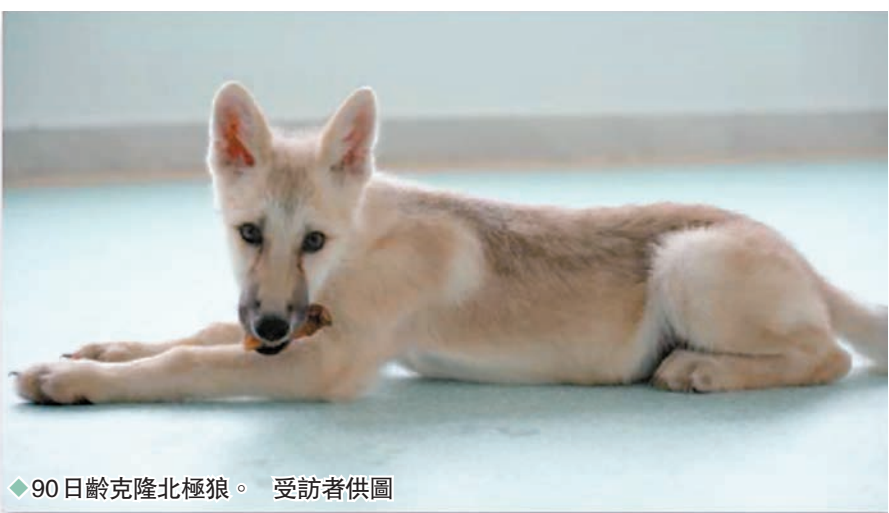
◆90日齡克隆北極狼。

當問及克隆北極狼是否會像普通動物一樣具有繁殖能力時,賀爭鳴對《環球時報》記者表示:「克隆動物依然具有繁殖能力,可以形成有繁殖活性的配子的,只要受精發育完好,克隆動物是可以有後代的。事實上,在美國,已經有克隆動物繁育的後代再克隆成功的先例。」