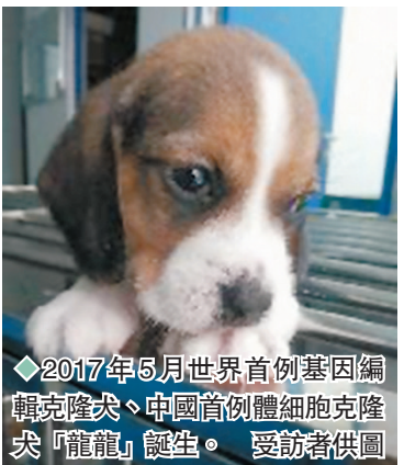
◆2017年5月世界首例基因編輯克隆犬、中國首例體細胞克隆犬「龍龍」誕生。