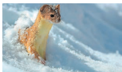
◆鮑永清作品《好大的雪》