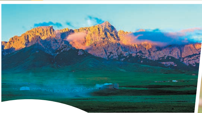
◆鮑永清作品《草原晨曲》

2019年鮑永清拍攝了一幅名為《生死對決》的 照片，獲得當年BBC英國國際野生動物攝影大賽的