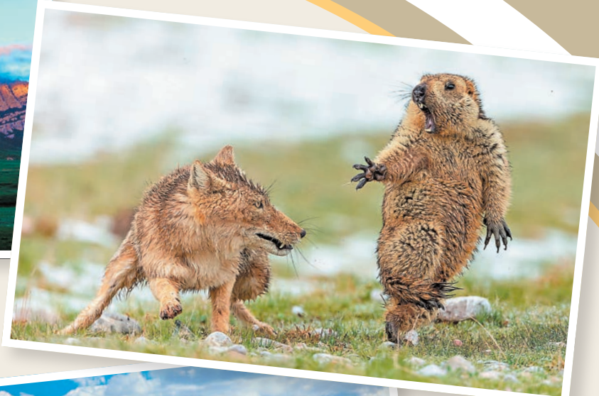
◆鮑永清憑借作品《生死對決》榮獲2019 BBC英國國際野生動物攝影大賽年度總冠軍。