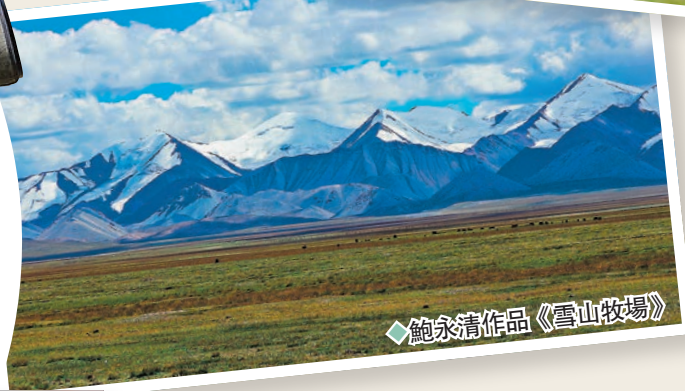
◆鮑永清作品《雪山牧場》