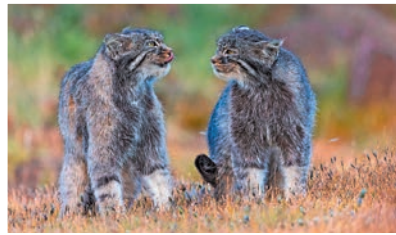
◆鮑永清作品《兔狲爭霸》