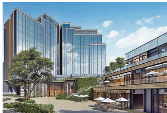
◆帝盛啟德酒店計劃走高端路線，將融入藝術及文化元素。圖為酒店效果圖。