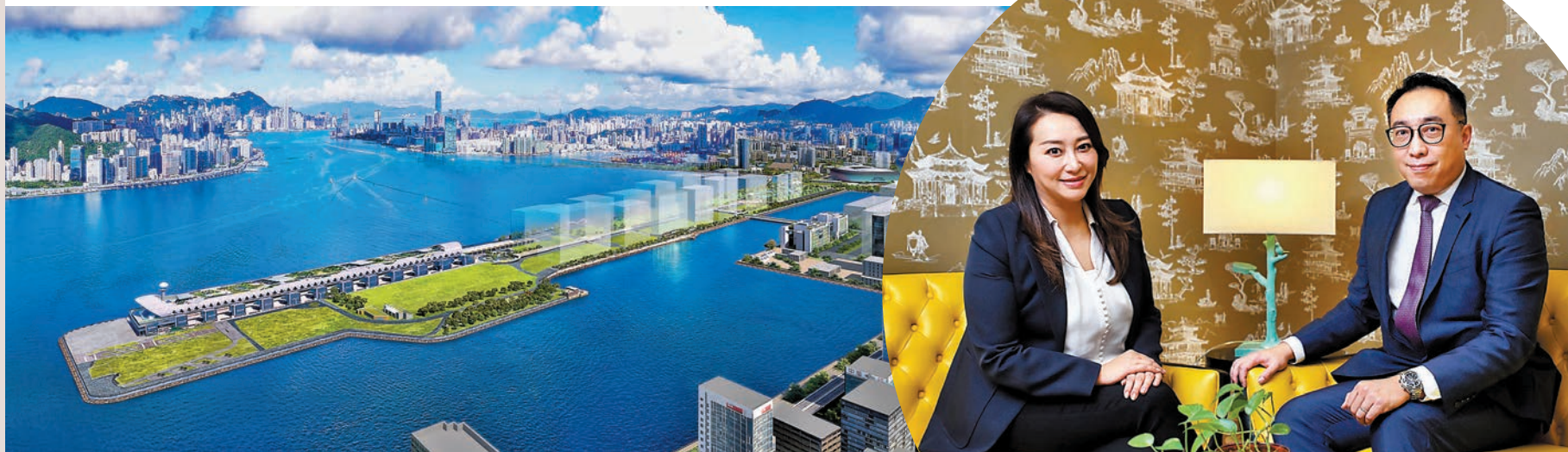
◆啟德區正發展成多元化文娛商業區。