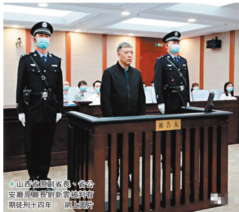
山西省原副省長、省公安廳原廳長劉新雲被判有期徒刑十四年。網上圖片

山西原副省長劉新雲囚14年 重慶原副市長鄧恢林囚15年 上海原副市長龔道安無期徒刑