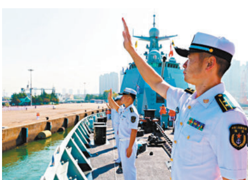
21日，中國海軍第42批護航編隊從山東青島某軍港解纜起航。圖為官兵在揮手告別。

載直升機2架、特戰隊員數十名。除可西里湖艦執行過亞丁灣護航任務外，淮南艦、日照艦均首次執行護航任務。