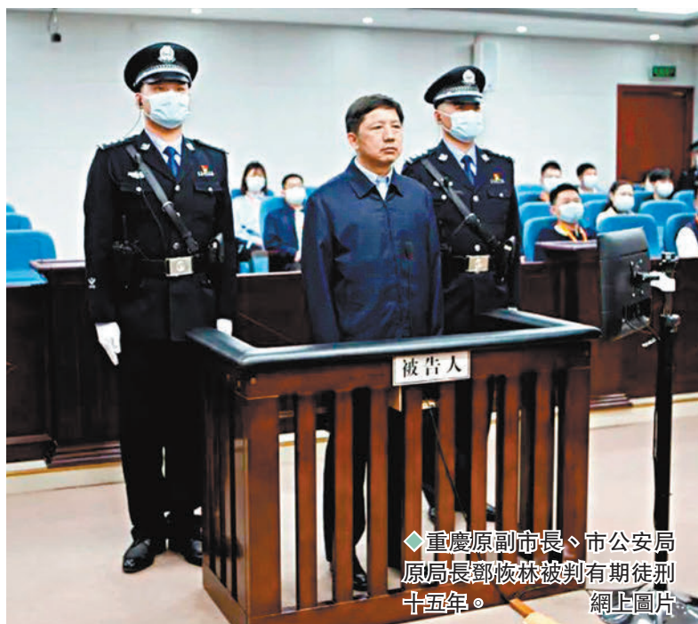
重慶原副市長、市公安局原局長鄧恢林被判有期徒刑十五年。