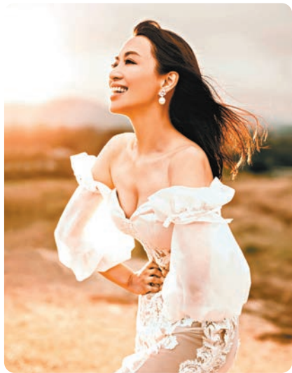
煒哥難得性感大放送。

而婚宴場地布置就以夢幻花藝為主題式布置，以綠葉襯搭新娘最喜歡的白色系和淡粉紅色系玫瑰花，並注入喜悅氣氛。