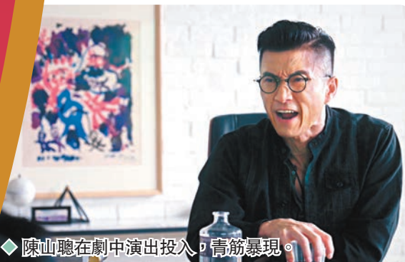
陳山聰在劇中演出投入，青筋暴現。