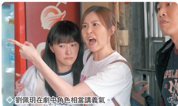
劉佩玥在劇中角色相當講義氣。