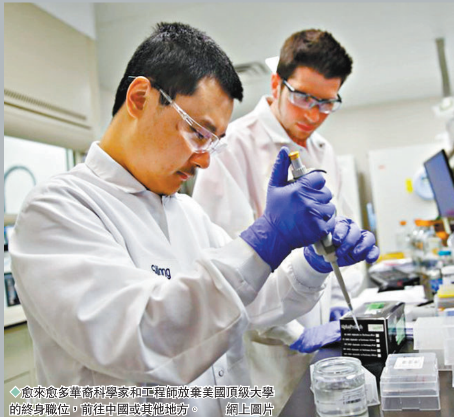
◆ 愈來愈多華裔科學家和工程師放棄美國頂級大學的終身職位，前往中國或其他地方。