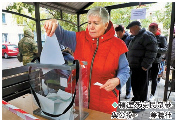
◆ 頓涅茨克民眾參與公投。