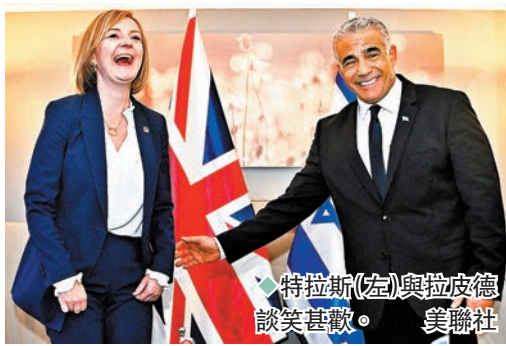
特拉斯(左)與拉皮德談笑甚歡。