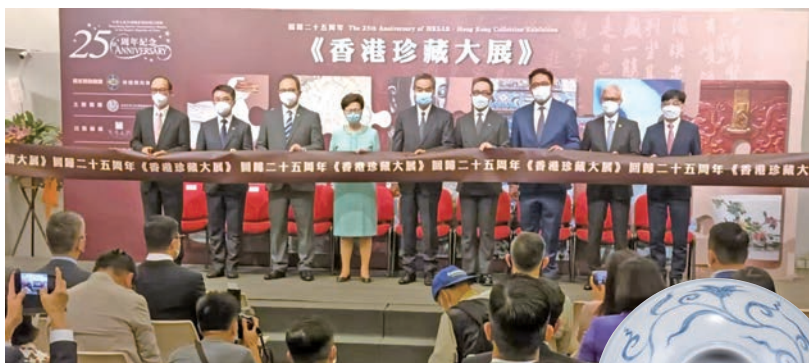
一眾嘉賓為香港珍藏大展剪綵。