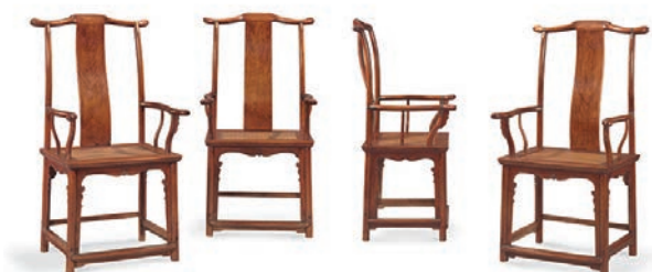
明16世紀末/17世紀初 黃花梨四出頭官帽椅一套四張