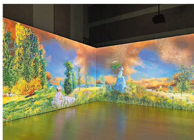
◆記者會上的沉浸體驗。