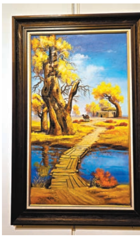
◆李世魁《龜茲》壁畫（紙質版）