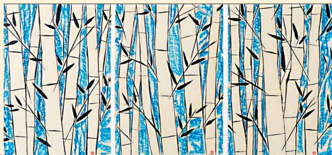
◆阿根廷藝術家費德里科·巴徹爾作品《藍竹》。