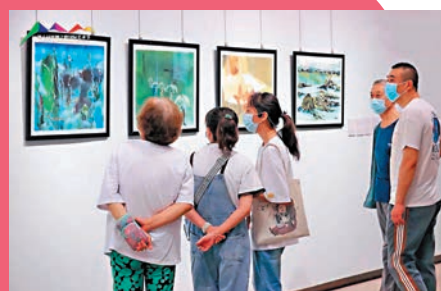
◆展覽吸引了眾多西安市民參觀。

今次展覽還舉辦了藝術分享會，兩位參展的拉美藝術家，向觀眾介紹了拉美藝術文化發展歷程，分享了參加交流活動的經歷及創作理念。未能親自前來現場參展的拉美藝術家，亦通過視頻向現場觀眾分享了在中國采風的感受。主辦方表示，今次展覽不僅是對過去十年的回顧，更是對中拉各國在未來更加深入的文化、藝術等全方位交流的展望。但願以藝術線條勾勒民心相通畫卷，傳承和詮釋絲路精神、推動中拉文明互鑒。