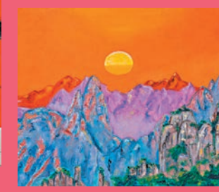
◆格林納達藝術家特里西亞·巴瑟爾創作的《黃山》。