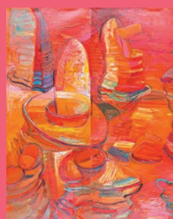
◆牙買加藝術家布蘭恩·馬克法蘭作品《紅石林之紅》。