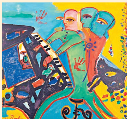
◆現場展出的巴西藝術家費爾南多·巴賽哥作品《獻給杭州的詩》。

過去的10年間，由國家文化和旅游部國際交流與合作局支持舉辦的中拉藝術交流系列展覽活動持續舉行，搭建起中拉藝術家交流、展示與對話的空間。多位拉美藝術大師作品來華展出，帶來拉美藝術的奇異活力，中國藝術家也走出國門，展現了東方審美的雋永意趣。今次展覽由文化和旅游部國際交流與合作局、陝西省文化和旅游廳主辦，梳理了近10年中拉藝術交流系列活動的合作成果和創作精品。作品不僅呈現了阿根廷、巴西、秘魯、哥倫比亞、哥斯達黎加、古巴、牙買加、墨西哥、烏拉圭、智利等13國26位藝術家歷年來華采風創作成果，同時還包含3幅哥倫比亞國寶級藝術大師費爾南多·博特羅畫作（複製品）。