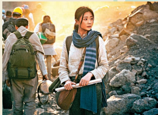
◆殷桃飾演撤僑同胞白嫻。