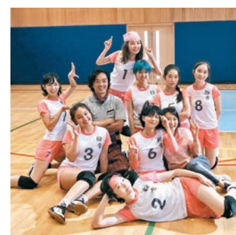
◆《深宵閃避球》下周四上映。