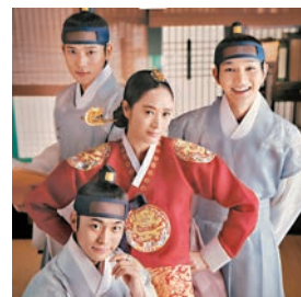
◆金惠秀主演新劇《雨傘》劇照。