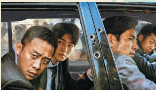
◆張譯、王俊凱在戲中有令人讚嘆的演出。