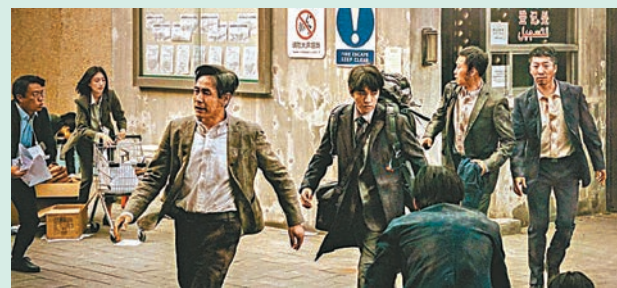
◆《萬里歸途》主題曲《歸途有風》由王菲獻唱。

其實，每個演員扣人心弦的真實細膩的表演，讓電影不僅可觀性強之餘，對白「祖國不會放棄任何一位同胞」這句台詞太有力了！所以，同胞們，當你在海外遭遇危險，不要放棄，請記住，你身後有一個強大的祖國！為祖國感到驕傲和自豪！