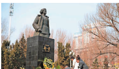
在東北烈士紀念館內的趙一曼紀念廣場，市民自發向趙一曼紀念塑像獻花。