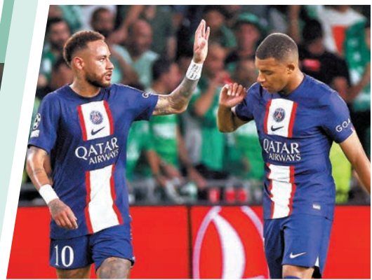
◆PSG就算輪換，實力仍會在對手之上。