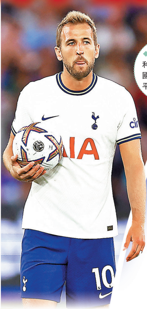
阿仙奴預計陣容 VS 熱刺預計陣容