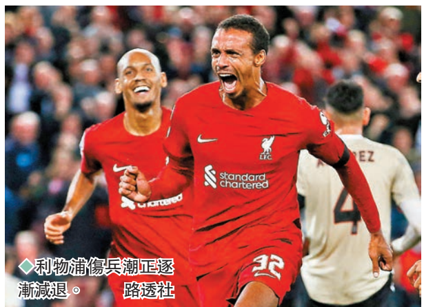
◆利物浦傷兵潮正逐漸減退。