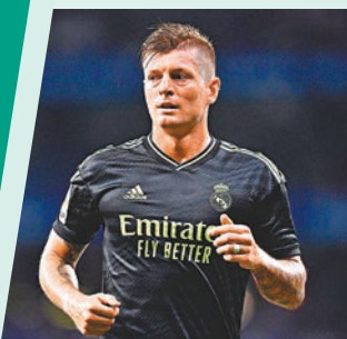
◆傳卸奧斯於明夏提早退役。