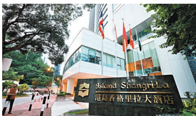
◆香格里拉酒店的客人數據庫被專業網絡攻擊者入侵。圖為香港島香格里拉大酒店。香港文匯報記者 攝

該集團旗下受影響的酒店有3間位於香港，另5間酒店為新加坡香格里拉公寓、新加坡香格里拉、清邁香格里拉、台北遠東香格里拉及東京香格里拉。集團強調，事件並未影響酒店的運作，已採取措施以加強資訊科技網絡的保安，並已就事件通報了相關機構及客人，又向受影響客戶致歉。