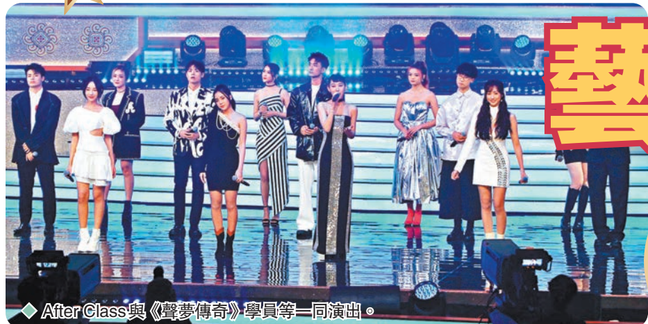
◆After Class與《聲夢傳奇》學員等同台演出。