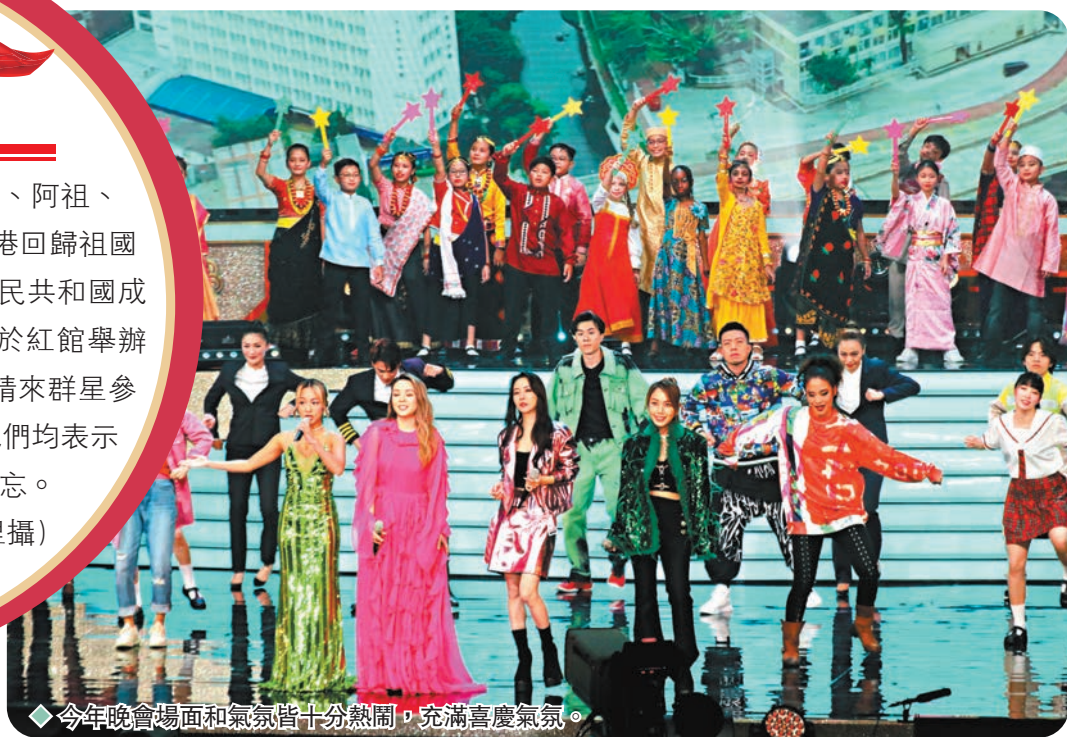
◆今年晚會場面和氣氛皆十分熱鬧，充滿喜慶氣氛。