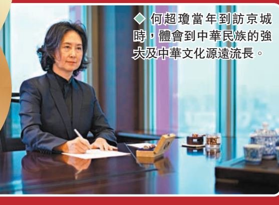
◆何超瓊當年到訪京城時，體會到中華民族的強大及中華文化源遠流長。

香港文匯報訊（記者 達里）由顧紀筠主持的全新節目《看見家書》緣起於香港婦協收到25封來自各階層人士的家書，憶述各自在回歸路上的經歷和對未來的願景，找來當中7位嘉賓在節目中現身回歸祖國後，如何秉持傳承、聯繫、改變及認同的理念，為香港未來發展再開新篇章。