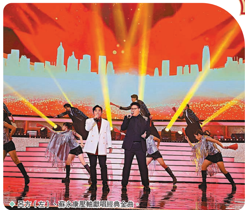
◆呂方（左）、蘇永康壓軸獻唱經典金曲。