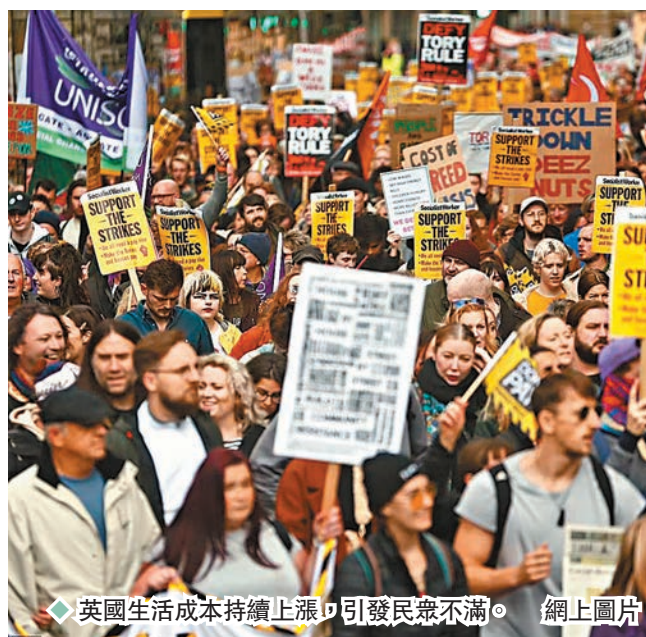
◆ 英國生活成本持續上漲，引發民眾不滿。網上圖片

英國通脹危機持續升溫，民眾今冬將面臨更高昂能源成本，全國各地群眾昨日均發起示威表達不滿，他們焚燒能源賬單抗議，又呼籲其他人不要繳交電費，鐵路和郵政工人同日亦進行罷工，進一步打擊經濟及民生。示威活動遍及全英逾50個城市，主辦單位估計，這是全國歷來抗議經濟危機的最大型示威。