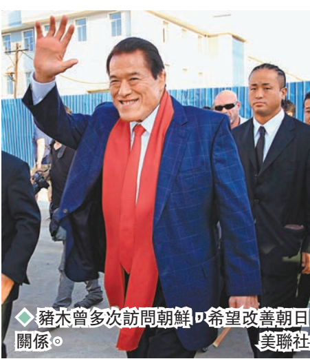
◆ 豬木曾多次訪問朝鮮，以希望改善朝日關係。

參議員回歸政壇；2019年以高齡為由未角逐連任，之後退出政壇。 豬木1990年任參議員時，曾在波灣戰爭期間包機前往伊拉克，與伊方談判，最終順利救出在當地成為人質的日本人。豬木在2013年首次到訪朝鮮，與當地重要人士會談及進行體育交流，之後在2016年至2018年連續三年訪朝，展