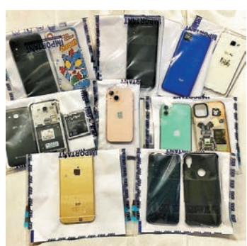
◆行動中檢獲的手機。

香港文匯報訊(記者 蕭景源) 警方早前調查發現，有不法分子利用青少年進行非法收債活動，遂在上周四(9月29日)至周五(9月30日)一連兩天，於全港多處採取