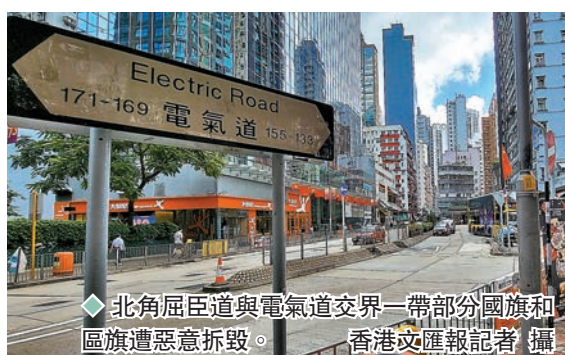
◆北角屈臣道與電氣道交界一帶部分國旗和區旗遭惡意拆毀。

昨日清晨5時20分，北角屈臣道與電氣道交界一帶，街上圍欄插滿國旗和區旗，但不知何時，有部分遭人惡意拆毀，將緊緊國旗及區旗的索帶和膠布剪斷，將拆下的國旗及區旗拋出馬路。部分旗幟更遭駛經車輛意外碾過，途人見狀報警。警員到場經