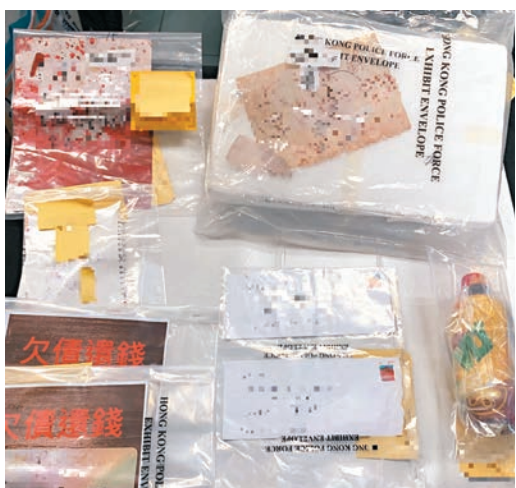
◆行動中檢獲的懷疑收債字條及裝有紅漆的膠樽。

香港文匯報訊(記者 蕭景源) 警方早前調查發現，有不法分子利用青少年進行非法收債活動，遂在上周四(9月29日)至周五(9月30日)一連兩天，於全港多處採取