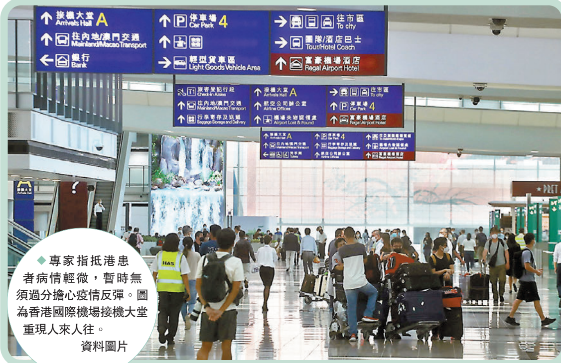
◆專家指抵港患者病情輕微，暫時無須過分擔心疫情反彈。圖為香港國際機場接機大堂重現人來人往。 資料圖片

不過，他指出有不少準新人已加訂酒席，惟婚宴一般會筵開20席或以上，而社團及同鄉會的酒席亦普遍有超過300人出席，限制宴會人數上限為240人，對生意仍有影響，而現時至農曆新年前均屬飲食業旺季，期望政府盡快進一步放寬社交距離措施。