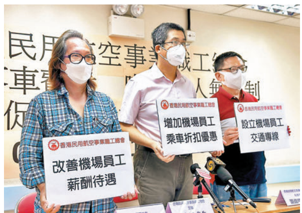
◆工會提出改善機場員工薪酬待遇等三大建議。

香港文匯報訊（記者 費小燁）隨着香港特區實施「0+3」入境檢疫政策，航空業終見曙光。然而，工聯會昨日公布的一項調查發現，58%受訪航空業工人指現時工作交通昂貴，60%受訪者指平日交通費佔薪金近10%、12%受訪者更指交通費佔薪金超過10%。工會指出，即使香港已踏入復常之路，航空業復甦，但到機場上班交通昂貴的問題沒得到足夠重視，期望能改善機場員工薪酬待遇、增加機場員工乘車折扣優惠及開設機場員工交通專線。