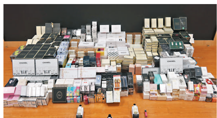
◆海關檢獲的部分假冒牌護膚品

香港文匯報訊 海關昨日公布，近日採取執法行動打擊網上售賣冒牌香水和化妝護膚品，檢獲共約1,300件懷疑冒牌產品，估計市值約36萬元，並拘捕一名女子。案件仍在調查中，海關正追查涉案貨品的來源，並會將樣本送往政府化驗所作測試，以確定其安全性。