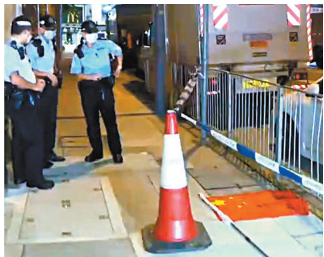
◆警方在上鄉道刑毀國旗區旗位置調查。 電視截圖

香港文匯報訊(記者 蕭景源)國慶節期間，除葵涌、北角、灣仔及深水埗接連發生4宗涉及國旗、區旗及國慶橫額遭惡意破壞或盜竊案外，昨日凌晨在土瓜灣上鄉道及馬頭涌道亦分別有國旗及區旗遭惡意拆毀丟在地上及垃圾桶內。警方指在過去4天發生的6宗同類案件中，合共拘捕3名涉案男子，現正追查其動機，不排除稍後會有多人被捕。