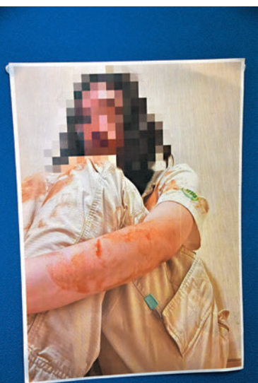
▶警方揭內地女生遇騙自拍被綁架片。