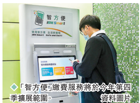
◆「智方便」繳費服務將於今年第四季擴展範圍。 資料圖片

香港文匯報訊（記者 文森）根據創新科技及工業局昨日提交立法會的文件顯示，提供一站式政府服務的「智方便」，