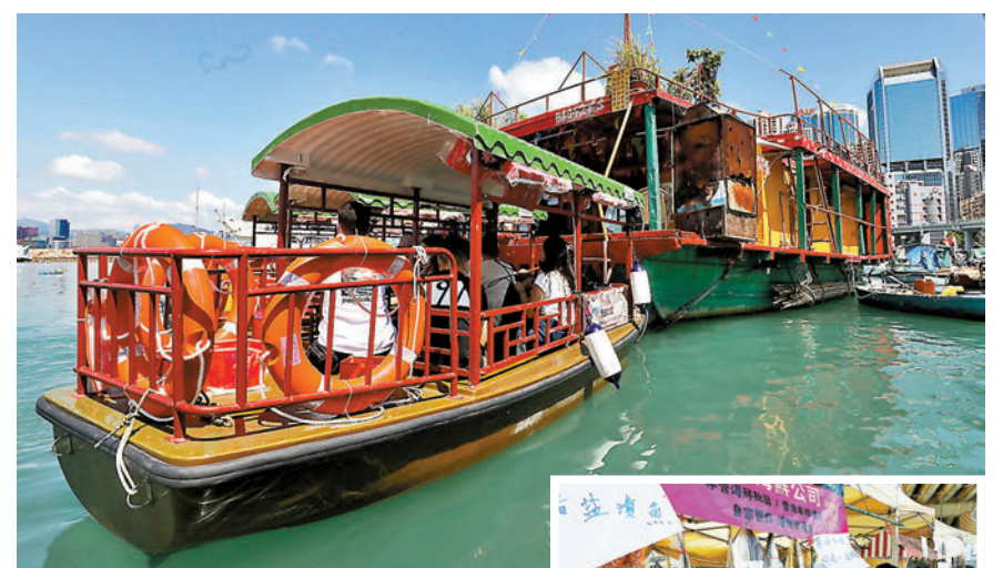
▲市民乘船前往香港唯一的水上船廟「水上三角天后廟」。

工聯會立法會勞工界議員郭偉強表示，疫情持續多時，大家都關心目前的就業情況，如何協助工友就業、轉型及再培訓等，其次是政府如何提振本港的經濟。他指，近期發生多宗嚴重工業意外，關注局方會否提高職安標準。