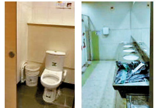
◆安達商場女廁廁板損壞。◆油麗商場男廁洗手枱損壞。

因，例如對承辦商制定KPI，改變公廁普遍待維修的狀態。他並指，公廁衛生問題皆因房委會檢查制度成效不顯著，建議引入公廁評分制度，讓市民直接對環境及清潔員的服務表現評分，鼓勵公司改善公廁問題。