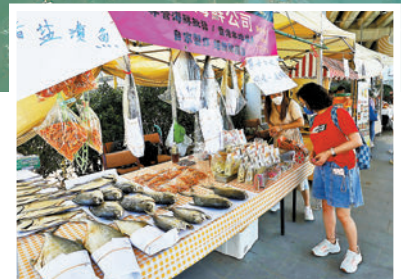
▶避風塘亦設有懷舊市集，方便遊客購買特色水產。

香港文匯報訊（記者 唐文）本月1日起，位於銅鑼灣避風塘海濱的「活力避風塘主題區」正式推出「Walla Walla 嘩嘩嘩歷史文化遊」導賞團，市民可乘坐3艘復刻舊式船隻的「嘩嘩嘩」（亦稱電船仔或水上的士），穿梭於避風塘，參觀有近70年歷史、全港唯一水上三角天后廟等景點，還可在限定水上市集購買特色水產，及投放祈願水燈。船票售價平日為140元。昨日香港文匯報記者親歷遊覽，欣賞海景之餘，還能聽船家介紹香港海運歷史，十分適合一家大細出遊。