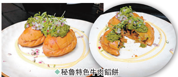
◆秘魯特色牛肉餡餅