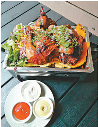
◆秘魯特色烤爐拼盤

再不夠就試埋秘魯傳統風味烤肉，還有煙燻鴨胸芫荽飯，是秘魯眾多菜中廣為人知的，鴨肉會在慢烤前輕輕煎香，經過 13 小時的油封，香氣撲鼻的鴨肉充滿油香，再拌上香菜、菠菜、洋葱、大蒜，黑啤酒一齊享用。