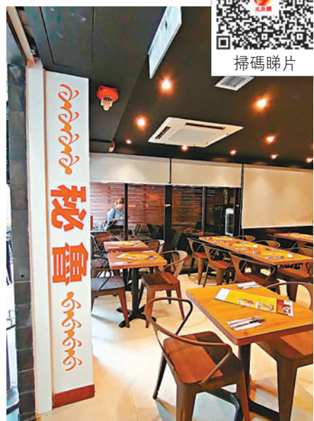
◆餐廳設計充滿秘魯風味。

秘魯芝士春卷，有別一般的脆口春卷，春卷有少脆又帶點煙韌的口感，一咬咬下流心般的芝士湧出，芫荽及黃辣椒醬更起了點睛作用，教人按捺不住，吃個不停。秘魯特色牛肉餡餅，牛肉餡餅常見於拉丁美洲飲食文化。餡餅是新月形，餡餅中都包裹着滿滿的鮮肉芝士和海鮮，鮮味十足。餡餅每天新鮮出爐，一上枱相機食先後即切，那餡餅脆口鬆化，牛肉粒即湧出來，入口肉味香濃，調味鹹甜適