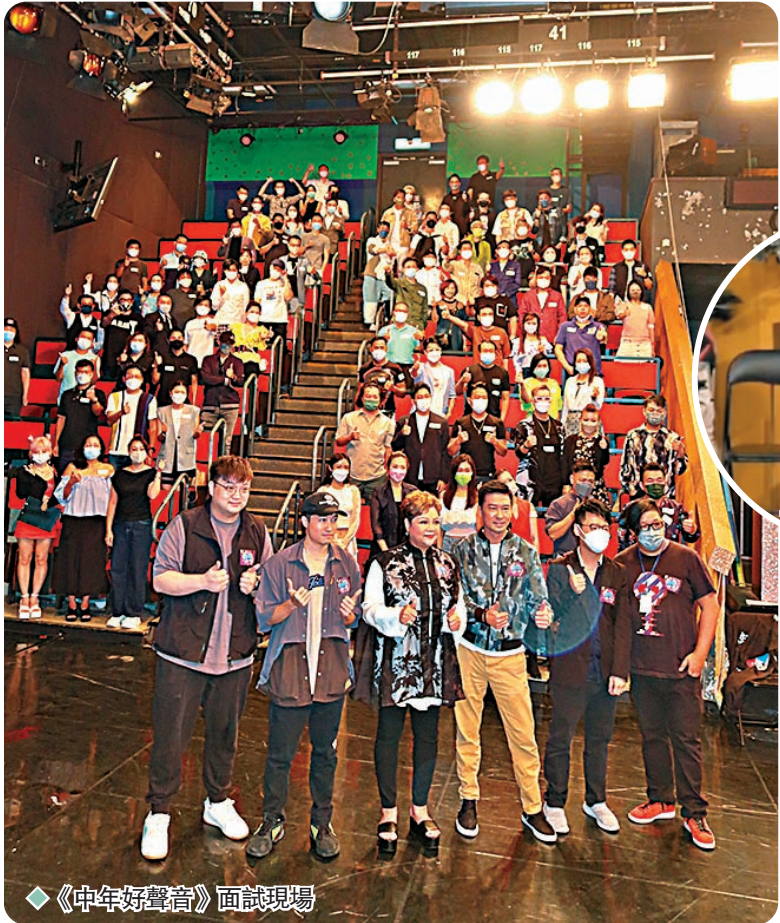
《中年好声音》面試現場