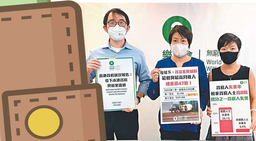
◆樂施會發現，香港最貧窮與最富裕家庭的月入中位數差距擴大至47.3倍。

新冠肺炎疫情衝擊香港各行各業，基層家庭更首當其衝，貧富懸殊情況越發嚴重。樂施會根據特區政府統計處的數據發現，香港最貧窮與最富裕家庭的月入中位數差距大幅擴大，由2019年疫情前兩者相差34.3倍，擴大至今年首季相差47.3倍。出現貧者愈貧、富者愈富的主因，是基層的低技術技能在疫下易被取代，而高收入者的技能卻難以被取代，且高收入者能透過聘請外傭照顧上網課的子女，基層婦女卻被迫手停口停。樂施會呼籲特區政府延長「臨時失業支援」計劃至今年底，亦建議將最低工資上調至每小時45.4元，並落實一年一檢，預計最少能惠及近34萬名低薪工友。