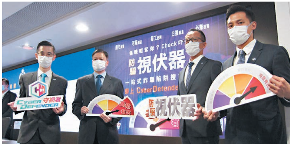
◆警方首次推出「防騙視伏器」協助市民評估詐騙及網絡安全風險。

此外，「防騙視伏器」提供的資料只用作防騙及偵查罪案，任何人若利用有關資料作其他用途，有可能觸犯《個人資料(私隱)條例》。